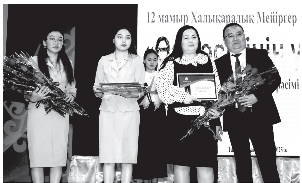
12 мамыр Халықаралық Мейіргер