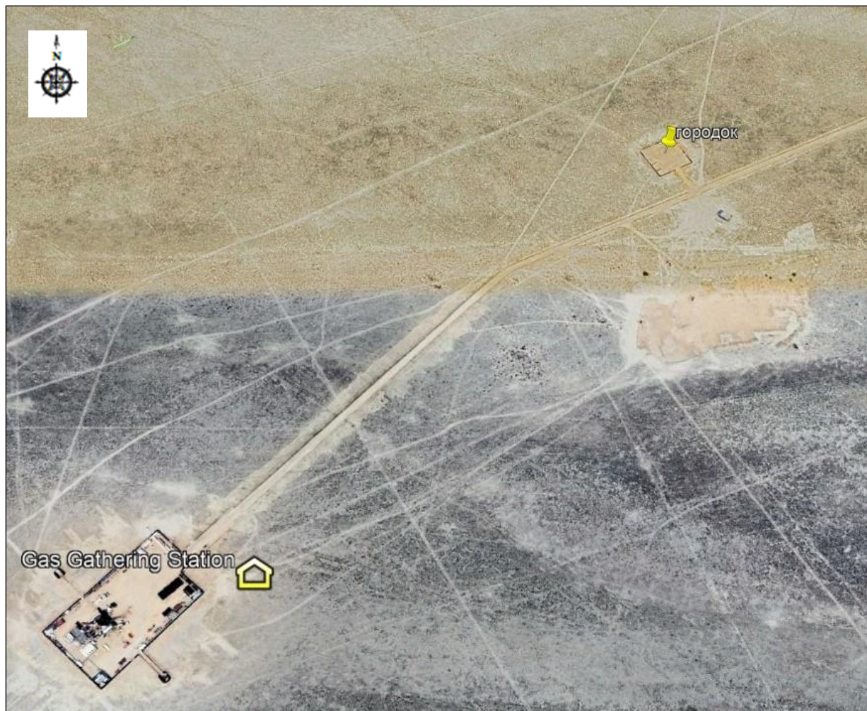
Рисунок 1.5 Ситуационная схема

В административном отношении участок работ находится на территории Бейнеуского района Мангистауской области (Рис.1.5).