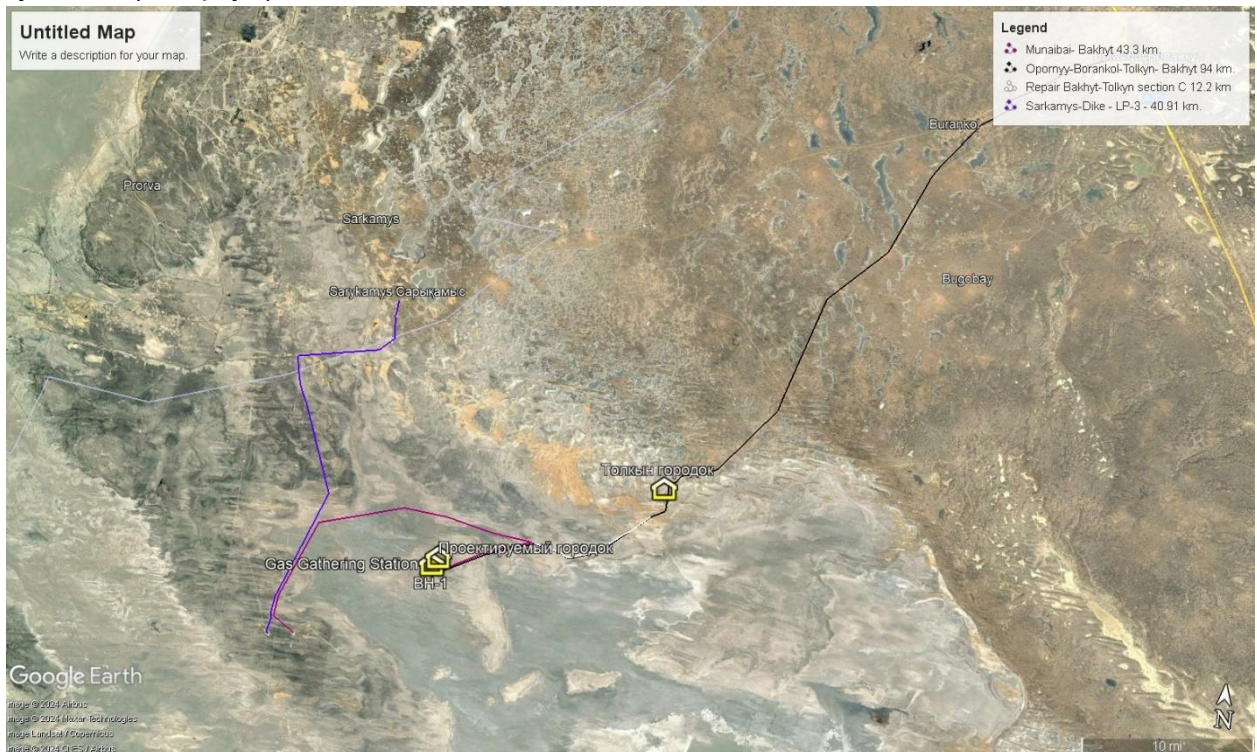
Рис.2.2-1. Расположение участка на местности

Участок работ расположен в пределах сора Мертвый Култук. Климат резко-континентальный с обилием солнечной радиации, незначительным количеством осадков и активной ветровой деятельностью. Лето жаркое, засушливое с сильными ветрами. Зима холодная и малоснежная. Район изысканий относится к зоне недостаточного увлажнения. Территория покрыта растительностью характерной для зоны засоленных пустынь и полупустынь (биюргун).