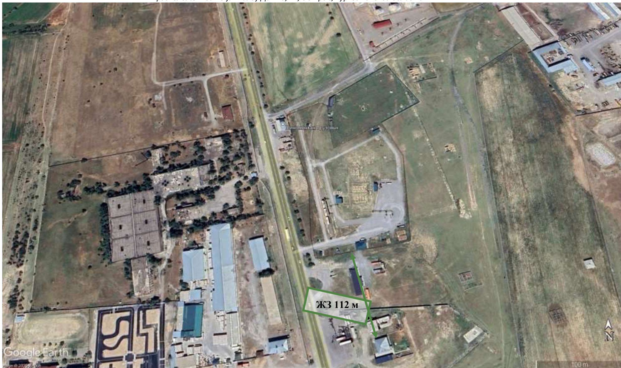
Рисунок 1.2 Космоснимок района размещения с указанием расстояния до жилой зоны.

ПЗ к Разделу «Охраны окружающей среды» для «Автозаправочной станции «KZ PETROLEUM», расположенной по ул. Калау Датка, 17, в г.Арыс, Туркестанской области».