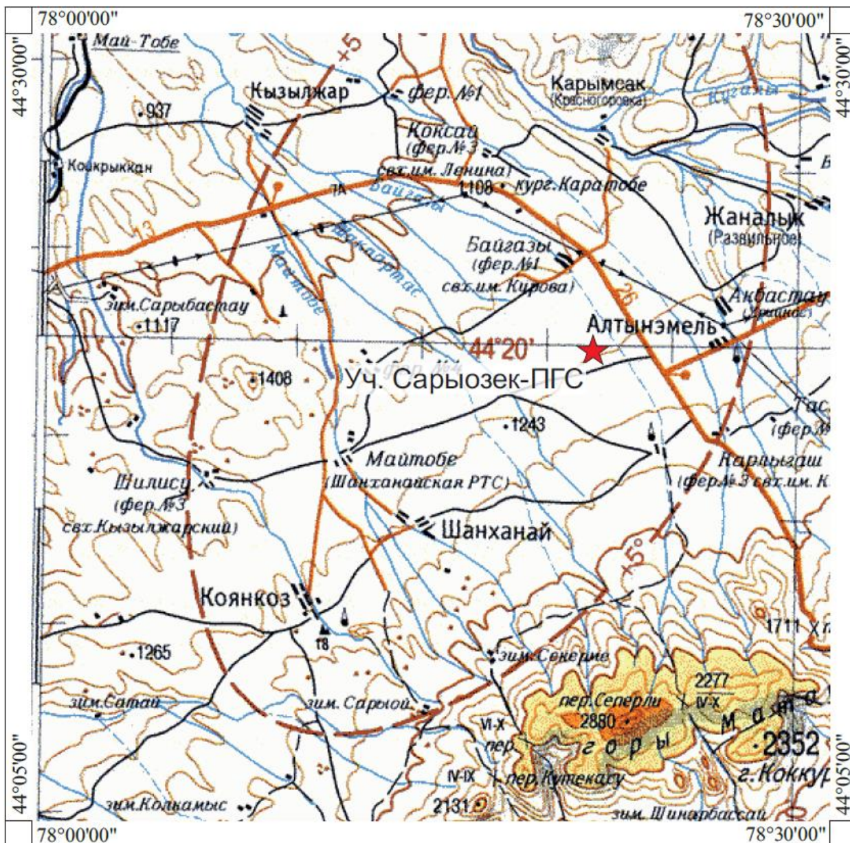
Рис.1 Обзорная карта расположения месторождения