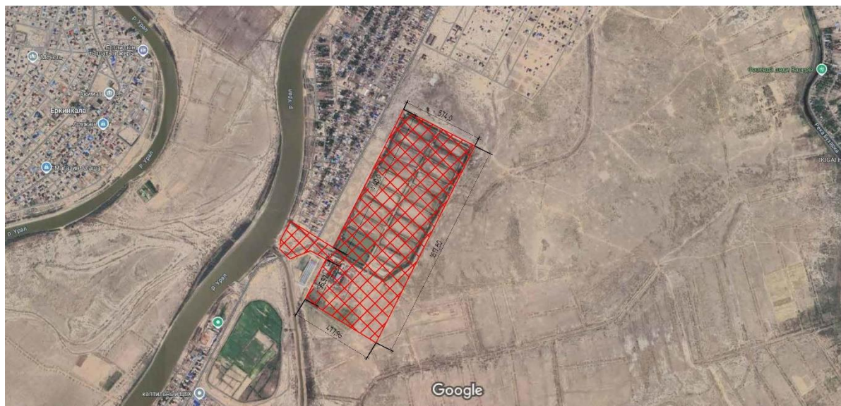
Рис.2-1. «Карта расположения района строительства»

В административном отношении район строительства расположен в городе Атырау областного центра Атырауской области, расположенной в городе Атырау, поселок Жанаталап.