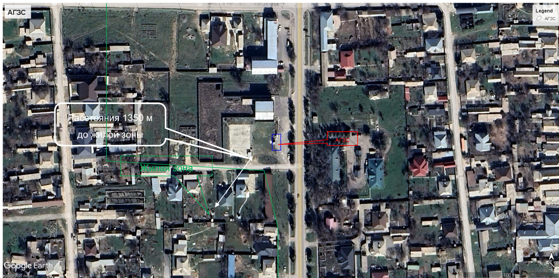
Рис.1 Ситуационная карта-схема