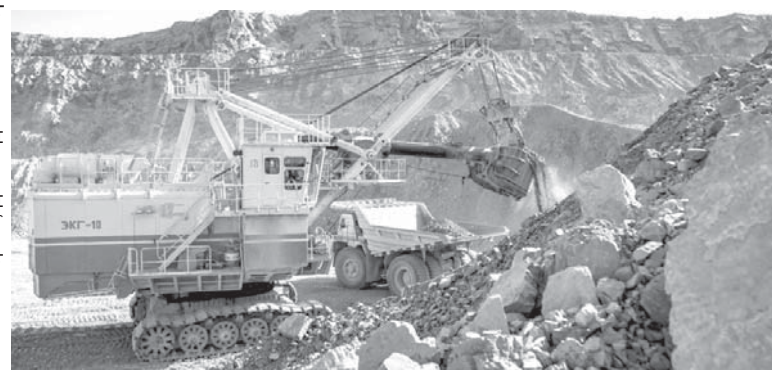
Бетті жинақтап, дайындаған: Әлия ҚҰРАЛБЕК

Экологиялық мониторинг үшін, оның ішінде шығарындыларды, судың ластануын және қоршаған ортаның жалпы жай-күйін нақты уақыт режимінде бақылау үшін жасанды интеллект негізінде сенсорлар мен шешімдерді белсенді енгізу.