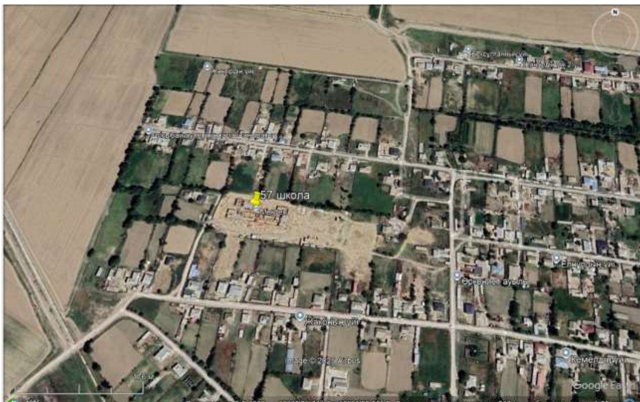
Рис.1. Обзорная карта района расположения объекта

Обзорная карта района расположения объекта и ситуационная карта с указанием расстояния до ближайшей жилой зоны и поверхностного водного объекта представлены на рис.1, 2 и 3.