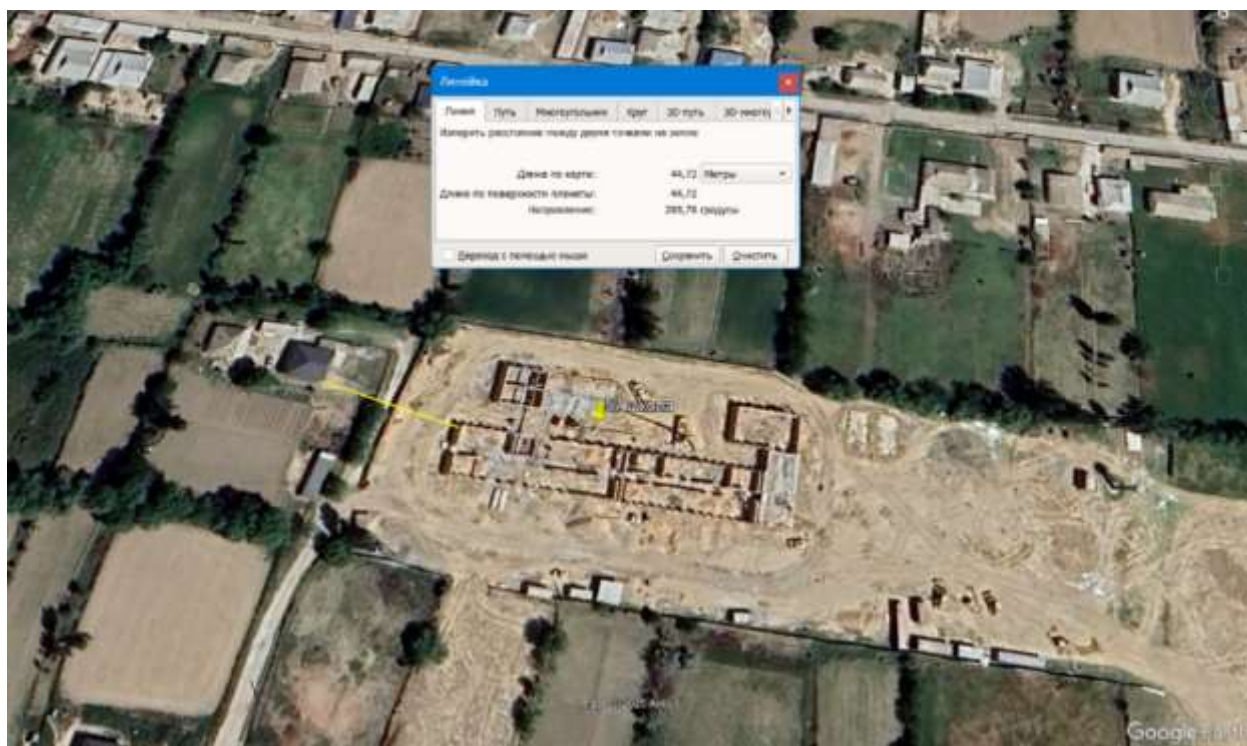
Рис.2. Карта-схема с указанием расстояния до ближайшей жилой застройки