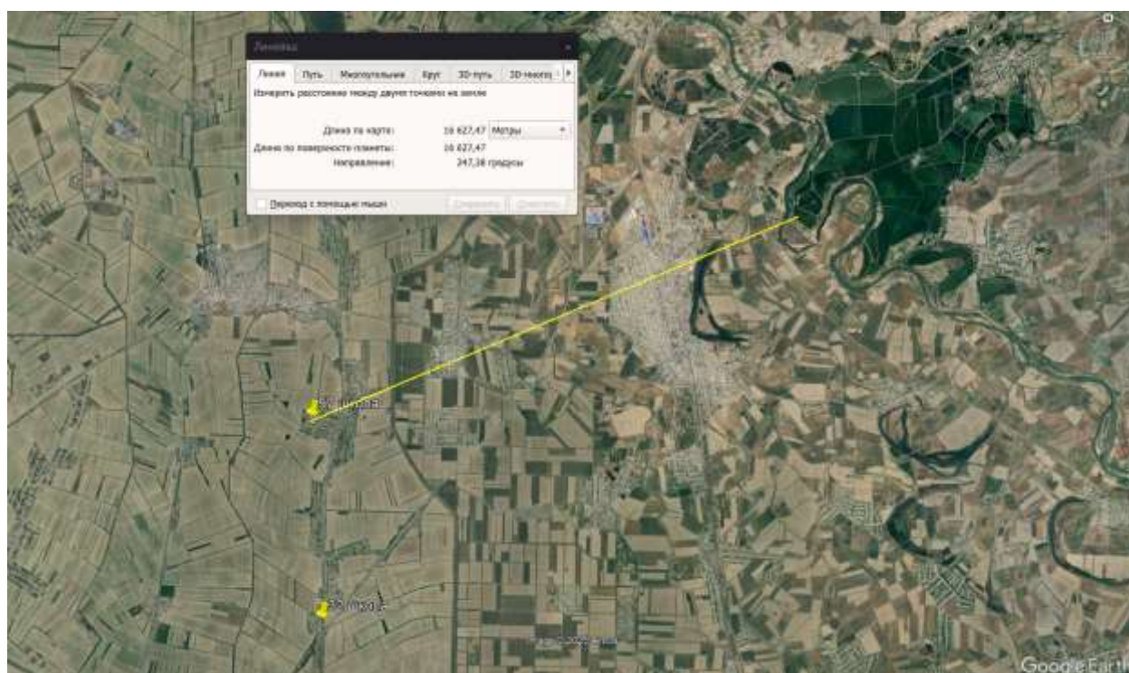
Рис.3. Карта-схема с указанием расстояния до ближайшего поверхностного водного объекта (водохранилище Шардара)