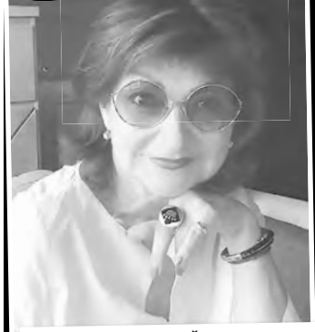
Звезды не смогли войти в одну реку дважды и теперь снова одиноки