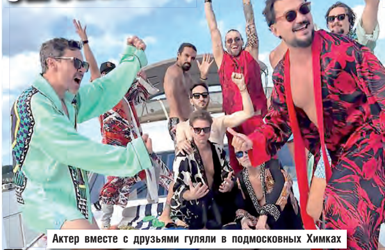
Актер вместе с друзьями гуляли в подмосковных Химках