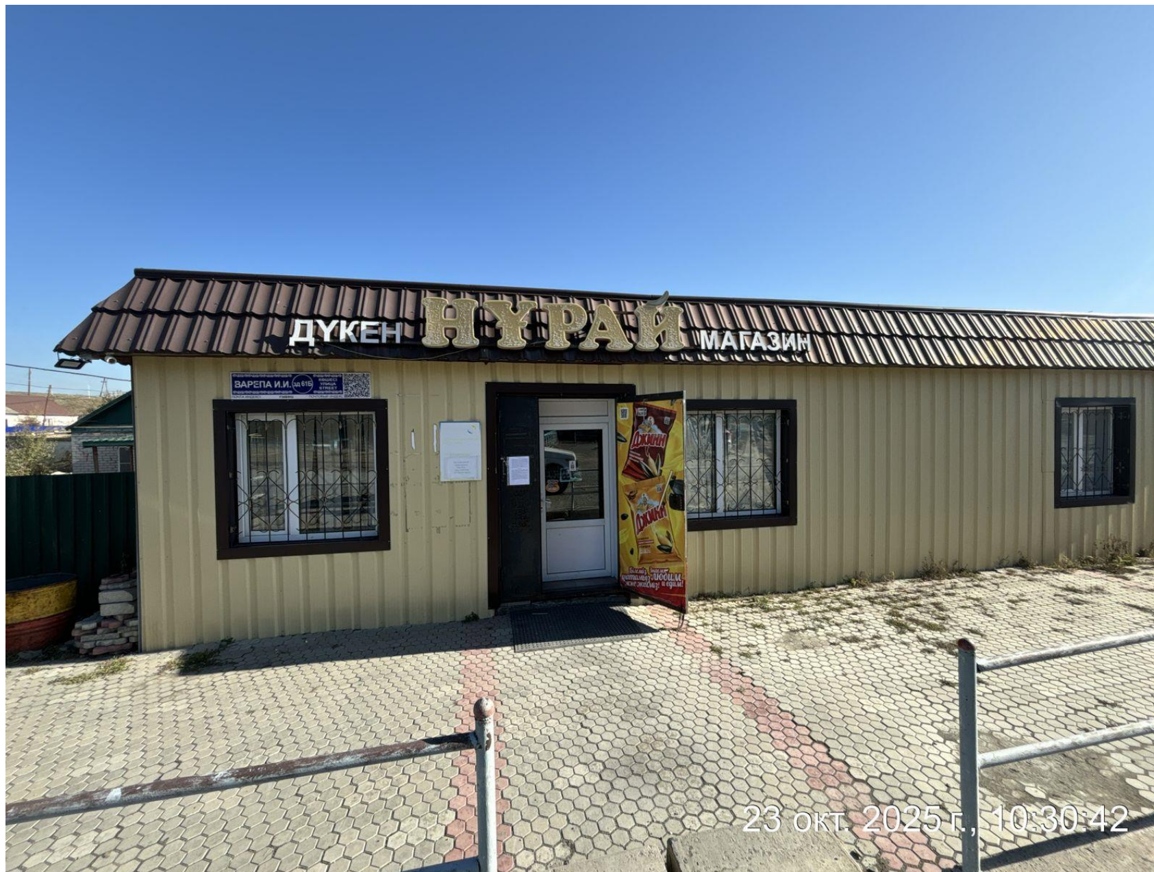
Доска объявления магазин «НУРАЙ» поселка Ауэзов, Жарминский район, область Абай