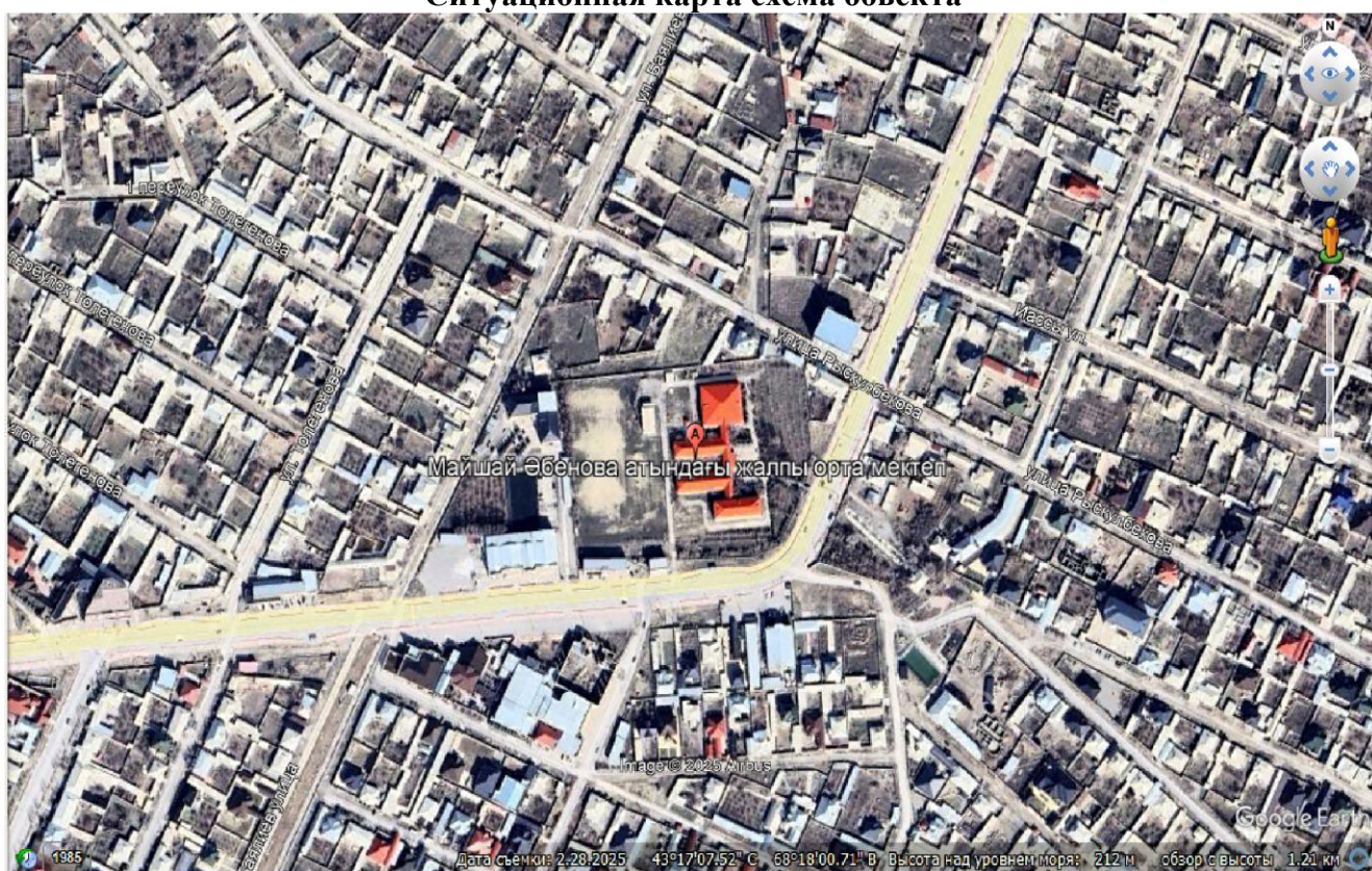
Ситуационная карта схема объекта

Здание школы. График работы 200 дней в году, 8 часов в день. Количество учащихся – 1070 мест. Количество учителей и техперсонала составляет – 160 человека.