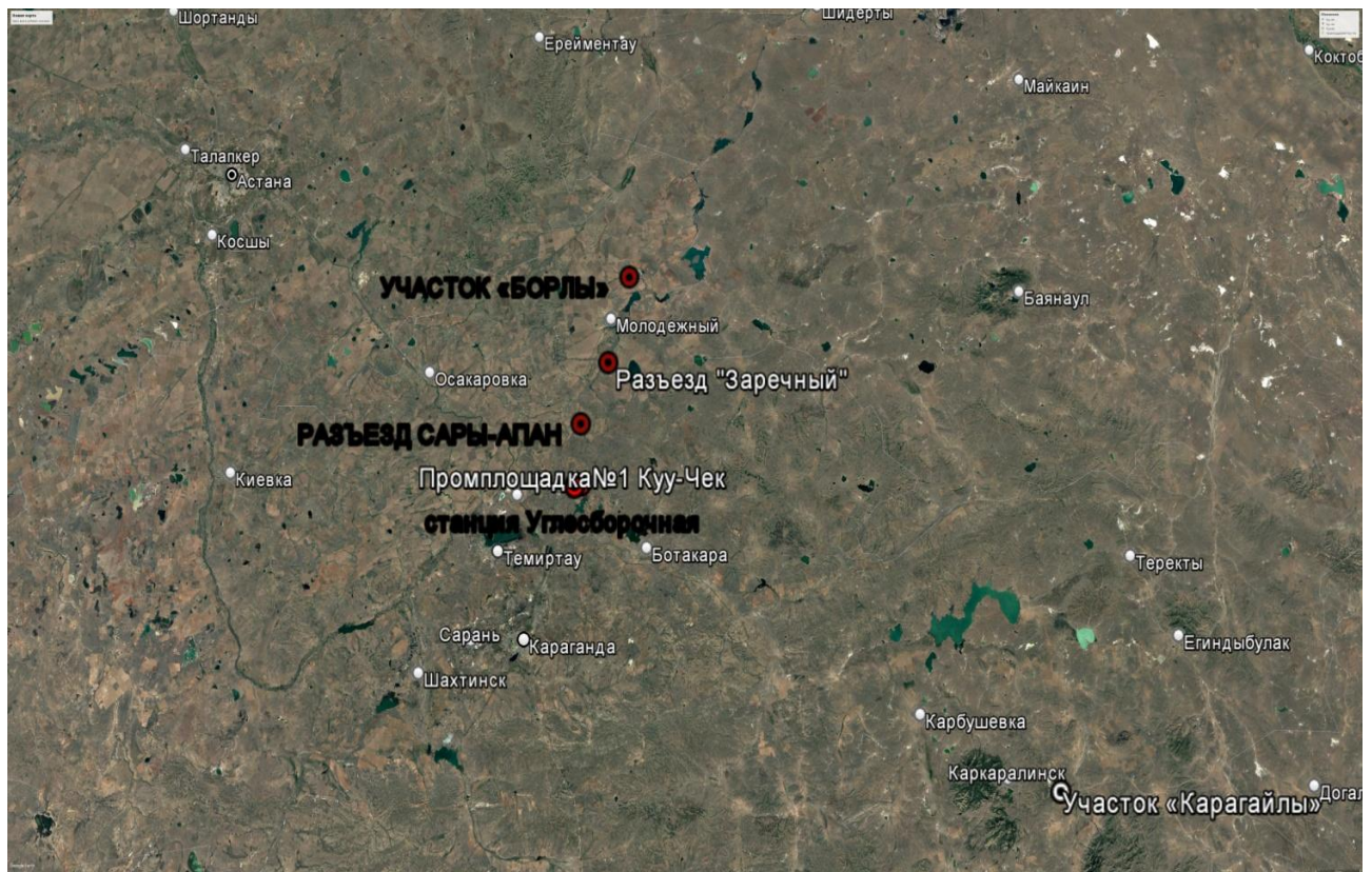
Рисунок 1.1 – Спутниковый снимок и обзорная карта района расположения объектов

Проект «Эксплуатация участков по обслуживанию и ремонту железнодорожных путей» для Филиала ТОО «Tranco Industrial Railways Transportation» в п. Кушоки» связана с объединением в филиал одного производственного объекта.