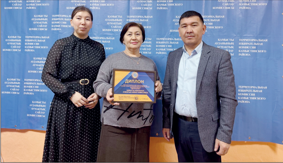
Коллектив районной ТИК всегда готов к обучению

Хотя основная миссия ТИК заключается в организации и проведении выборов на территории района, значительная часть работы ведётся именно во внеэлекторальный период. ТИК работает круглый год, укрепляя доверие граждан к избирательной системе и формируя ответственное отношение к участию в выборах. Особое внимание уделяется профессиональной подготовке, прохождению семинаров,