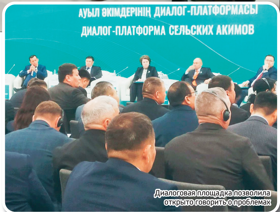
Диалоговая площадка позволила открыто говорить о проблемах

- Это крайне важный вопрос. Я стараюсь отдаваться полностью своей работе, чтобы принести пользу землякам, навести порядок в округе, а также значительно повысить уровень комфортности. Действительно, было бы