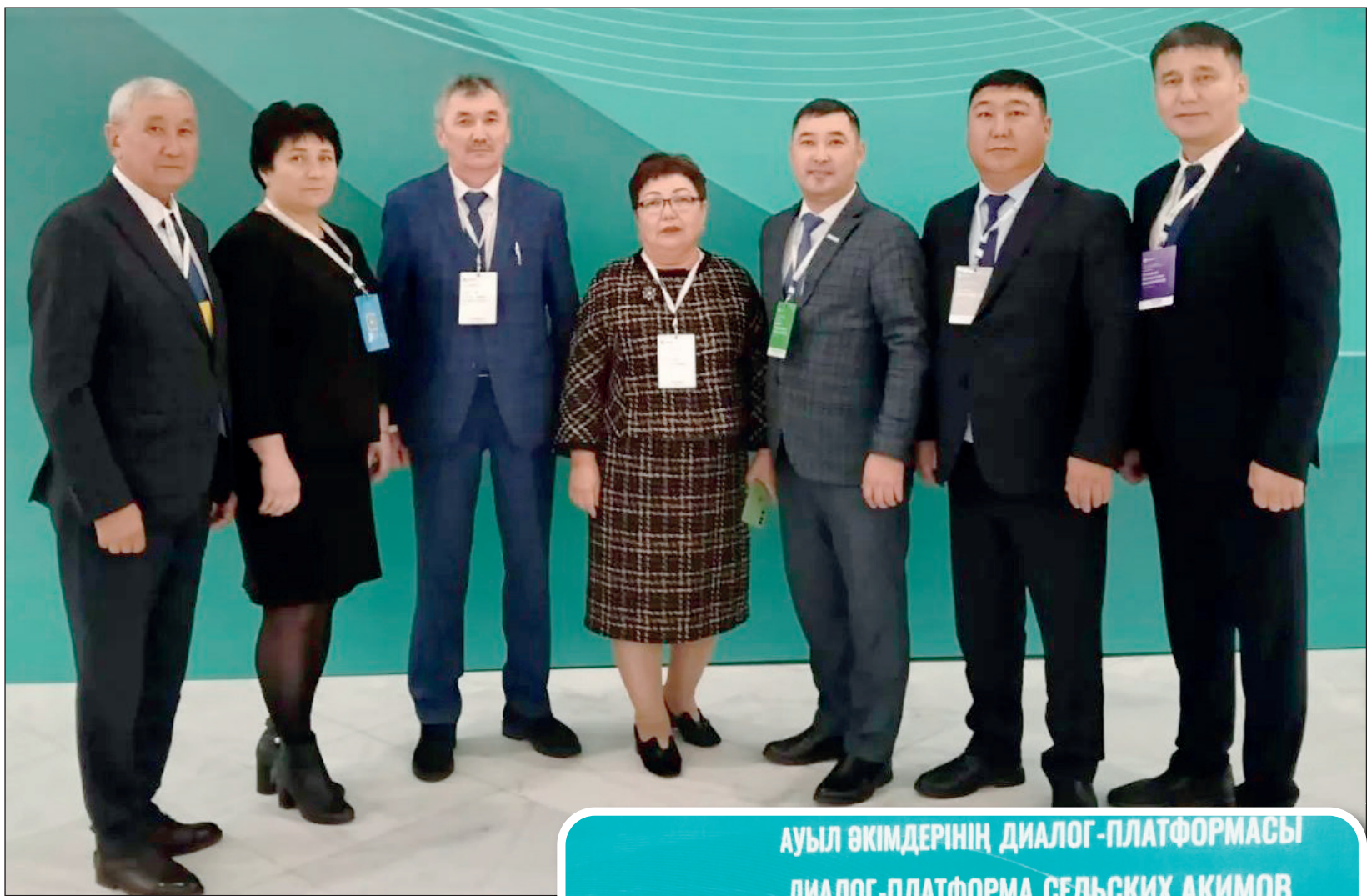
Сельские акимы обменялись опытом с коллегами из других регионов

На сессиях диалог-платформы были рассмотрены темы: развитие инженерной и социальной инфраструктуры; обеспечение качественного водоснабжения и модернизация дорог; поддержка сельских предпринимателей и создание рабочих мест; повышение прозрачности и цифровизации государственных услуг; совершенствование системы подготовки кадров для местного самоуправления.