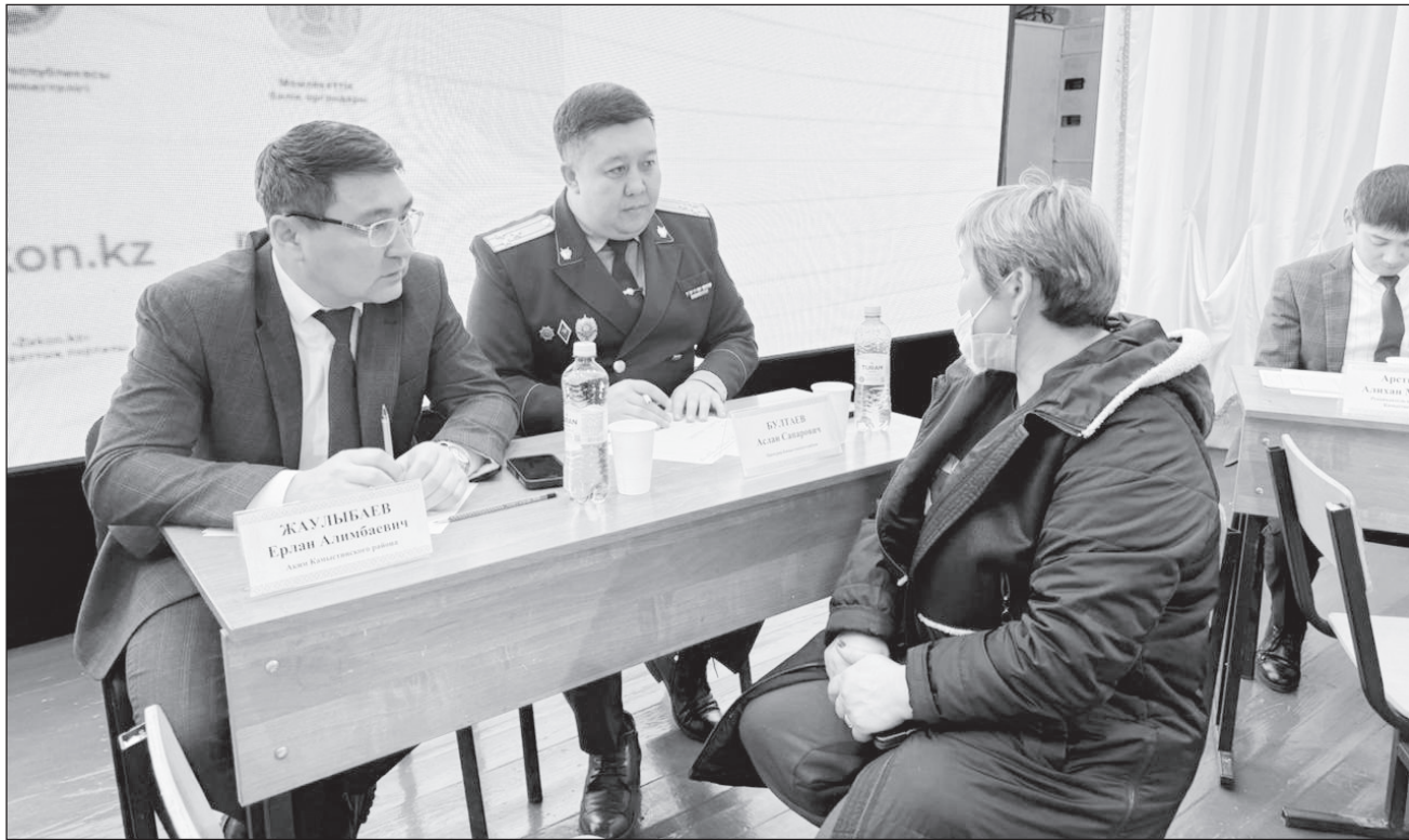
Аким и прокурор района провели консультации для жителей села Алтынсарино

Мероприятие прошло в Доме культуры, который посетили десятки сельчан. Эта акция стала возможностью напрямую пообщаться со специалистами, акимом района, прокурором района, представителями правоохранительных и государственных органов. Граждан консультировали по семейным спорам, земельным вопросам, трудовым конфликтам и оформлению социальных пособий. Специалисты