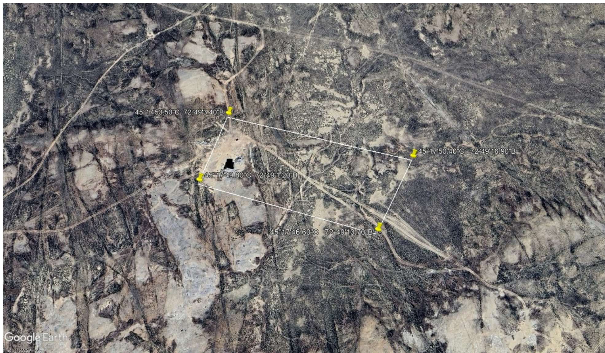
Рис.1 Ситуационная схема расположения объекта