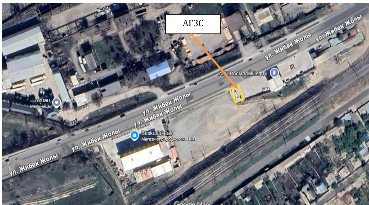
Рис 1. Ситуационная карта района расположения объекта.