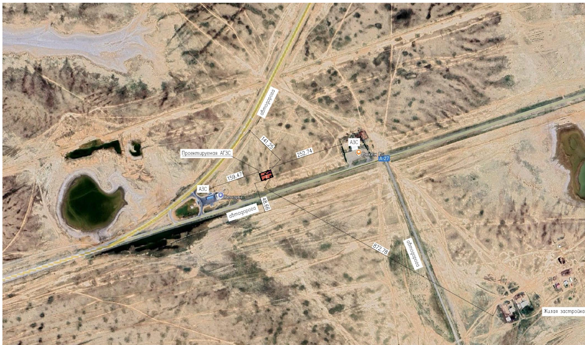
Рис. 1.1. Ситуационная карта расположение АГЗС