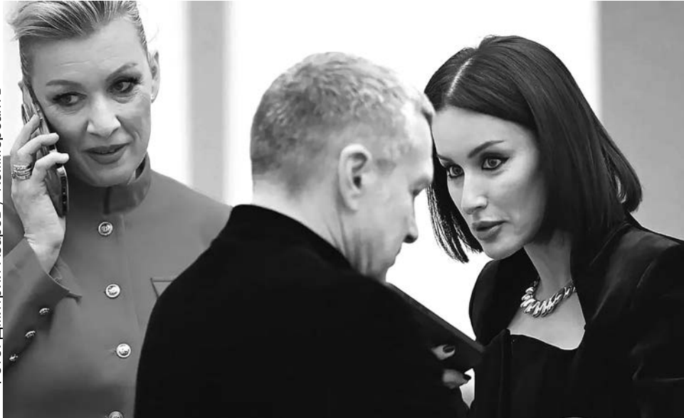
Церемония вручения государственных наград в Екатерининском зале Кремля. Слева направо: Мария Захарова, Владимир Соловьев и Тинатин Канделаки

Чувство Родины можно обрести, только умерев за нее (лучше, чтобы это был кто-то другой, а не ты лично), а не живя во имя нее.