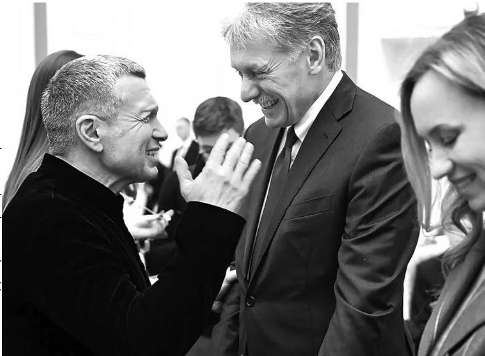
Дмитрий Песков (справа) и Владимир Соловьев на церемонии