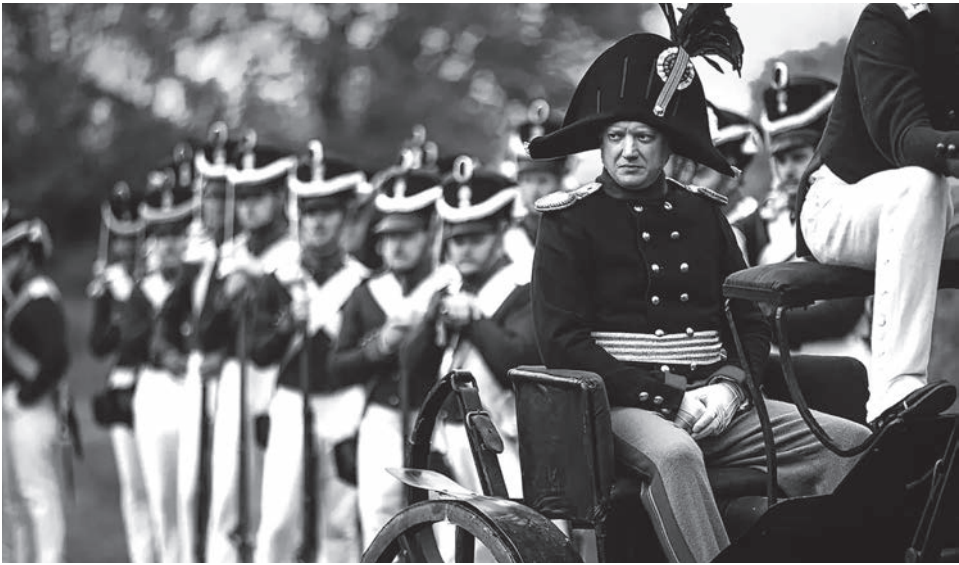
Кадр из сериала «Союз Спасения. Время гнева»

У амбициозного проекта большая и не очень внятная биография. Шесть лет назад он был просто фильмом, через какое-то время попытался расширить-