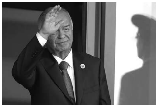
Президент Узбекистана Ислам Каримов