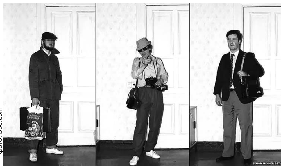
На фото видно, как агенты Штази меняли внешность, когда им нужно было передать тайные сигналы

Основа Порядка — незыблемость коллективной веры в его правоту. Это противопоставление Хаосу, который силён индивидуальными вспышками. Их невозможно регулировать, и ты никогда не знаешь, откуда прилетит или громкий успех, или громкий провал. Порядок опирается на стандарт и на то, что этого стандарта хватит всем. Но любая система стремится к энтропии — физику победить не могут ни Акорда, ни МВД с КНБ вме-