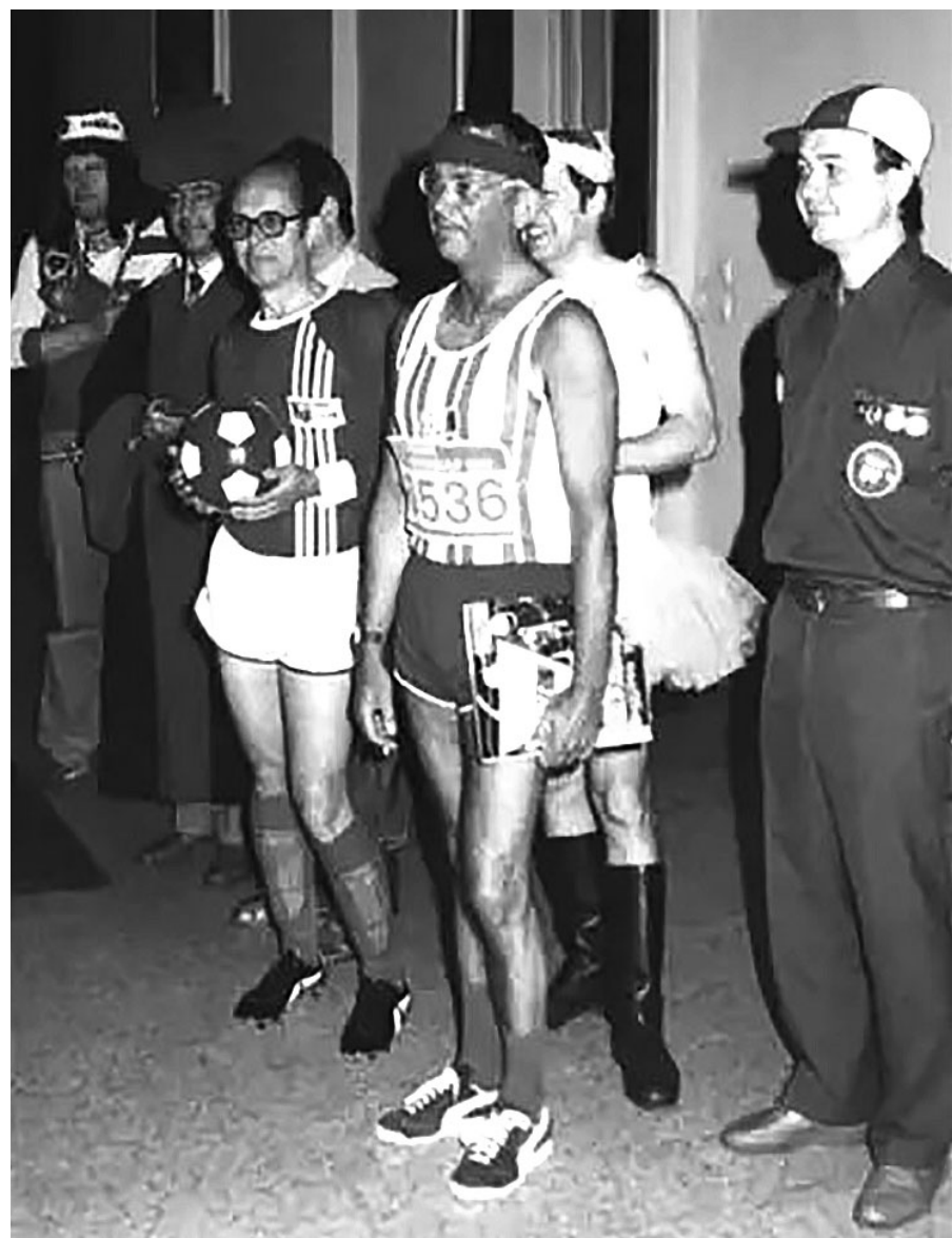
Празднование дня рождения одного из высокопоставленных сотрудников Штази. Гостей попросили надеть костюмы тех групп, за которыми они следили в повседневной жизни: спортсменов, пацифистов, футболистов и религиозных деятелей

Вячеслав ПОЛОВИНКО, специально для «Новой — Казахстан»