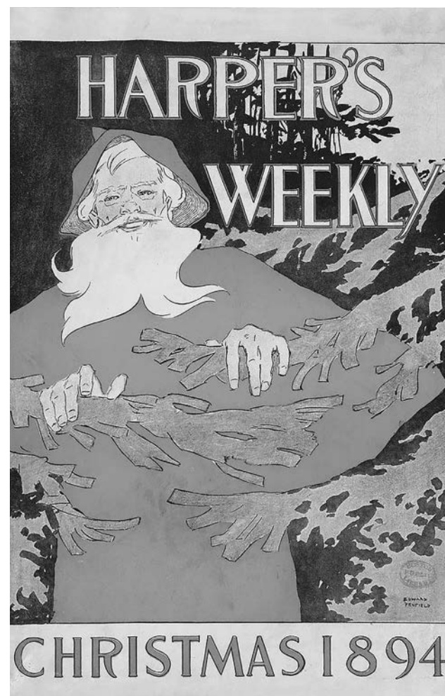
Журнал Harper's Illustrated Weekly, 1894 год

елка страны»: остальные елки — лишь ее иконы, отражения.