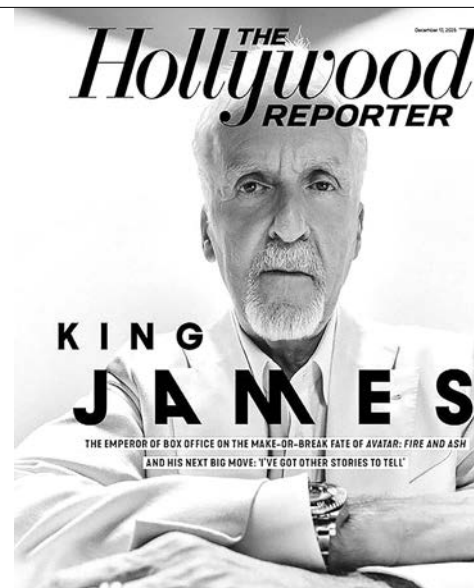
Обложка журнала Репортёр Голливуда за декабрь 2025