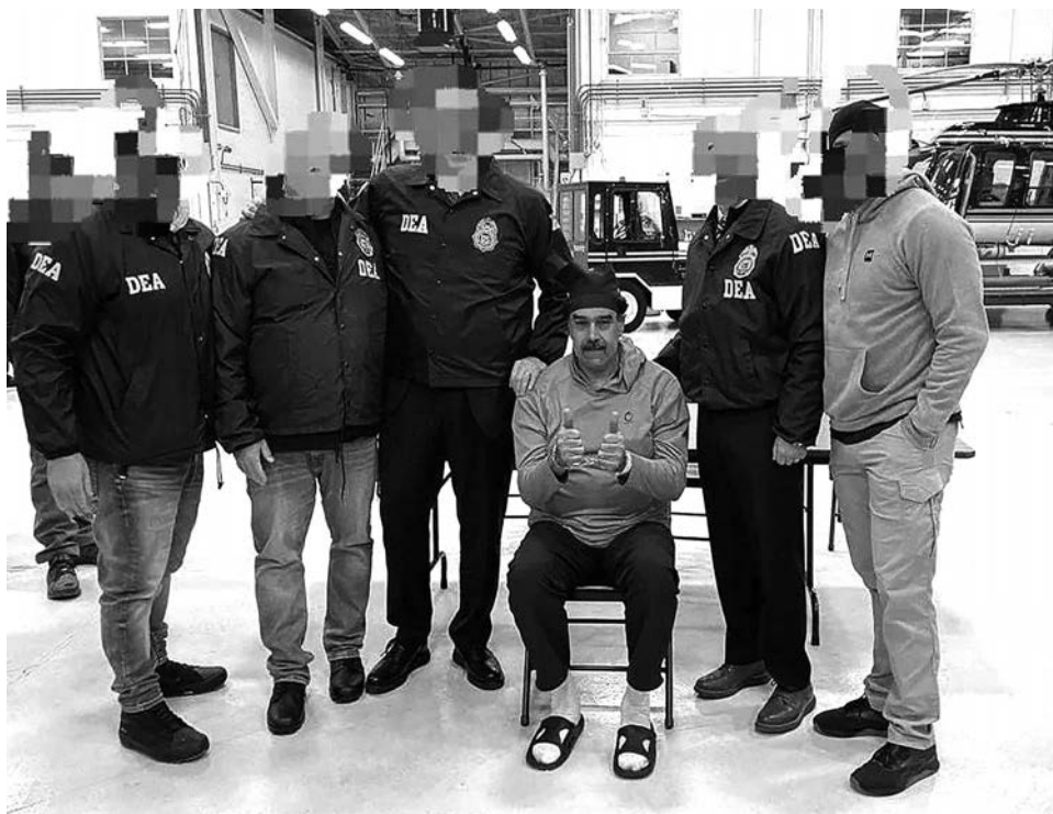
Захваченный властями США президент Венесуэлы Николас Мадуро