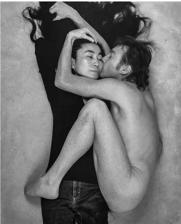
Йоко Оно и Джон Леннон для обложки журнала Rolling Stone

Съемка продлилась полтора часа, а в пять вечера Джон, Йоко и репортеры покинули здание. У ступенек, как обычно, толпились фанаты. Леннон всегда был до-