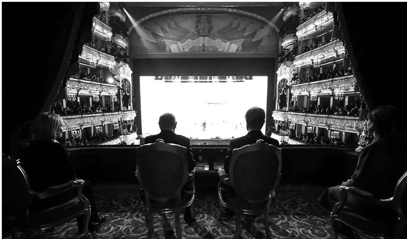
Государственный визит президента Казахстана Токаева в Россию