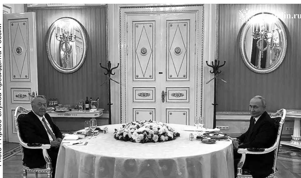
Назарбаев и Путин в Кремле

Но только Назарбаев из бывших лидеров СНГ в фаворе у Кремля. Судя по всему, ветеран советской политики и один из столпов СНГ в неплохой физической форме, нет претензий и к его ментальному состоянию. В Москве его ценят не только, как историческую персону переходного периода от СССР к независимым государствам Содружества, но и отчасти, в качестве столпа, реально еще существующего «Старого