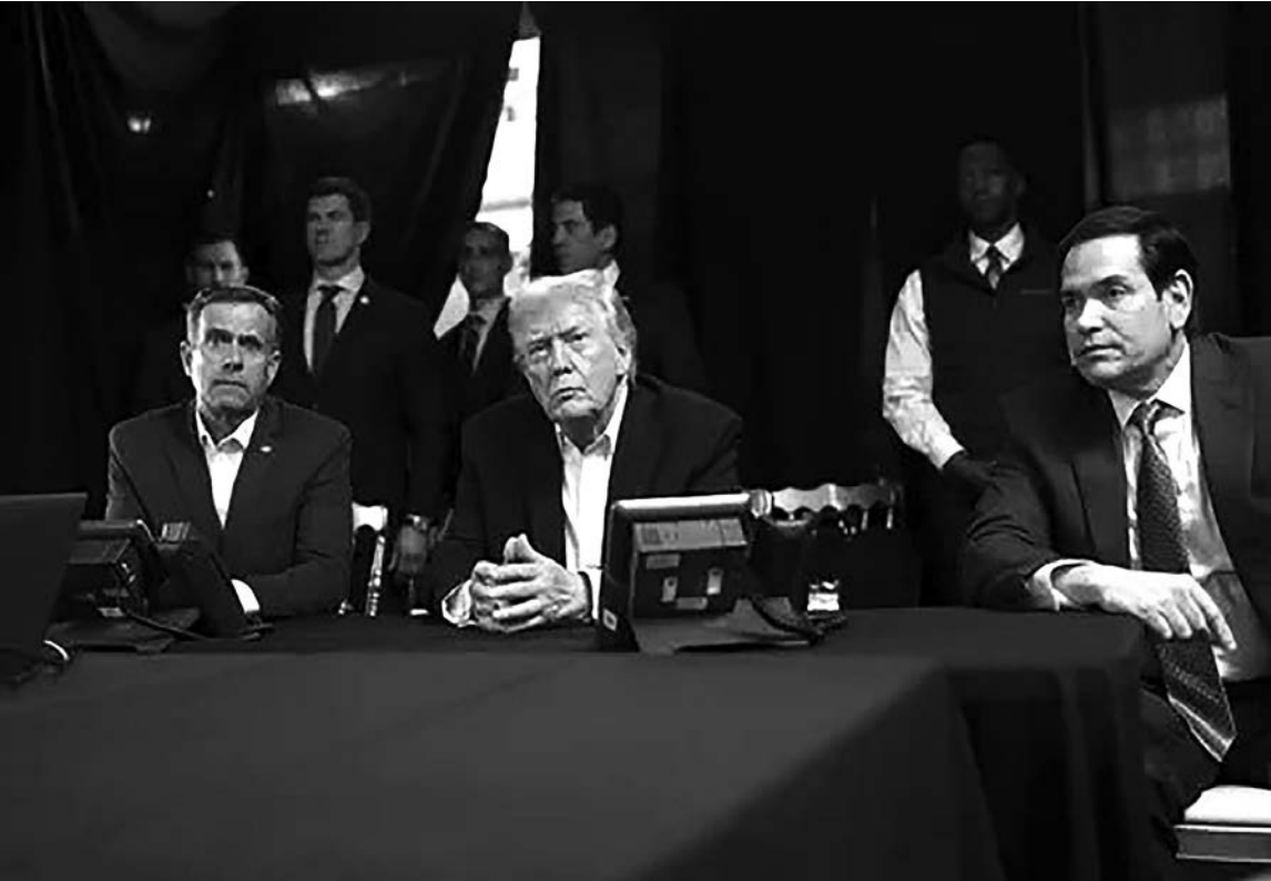
Дональд Трамп наблюдает за военной операцией США в Венесуэле из гольф-клуба Mar-a-Lago в Палм-Бич, штат Флорида, США, 3 января 2026 года