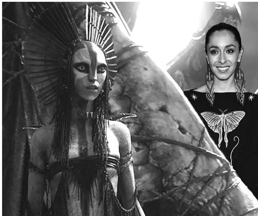
Аватар 3: Варанг-Чаплин

Мурат УАЛИ, специально для «Новой-Казахстан».