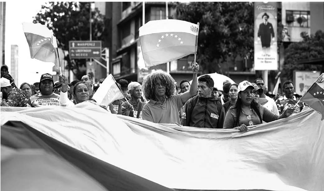
Участники марша, требующие освобождения Николаса Мадуро, держат флаг Венесуэлы, Каракас, Венесуэла, 4 января 2026 года

После того, как США провели военную операцию в Венесуэле и похитили президента страны Николаса Мадуро, фактическую власть в стране взяла на себя вице-президент Делси Родригес. Дональд Трамп теперь угрожает и ей, предупреждая об «очень высокой цене» при отказе от сотрудничества. Самого Мадуро, как и его жену, держат под стражей в Нью-Йорке. Уже сегодня, 5 января, они предстанут перед судом: им зачитают обвинения в наркотрафике и терроризме. Подробнее — в материале «Новой-Европа».