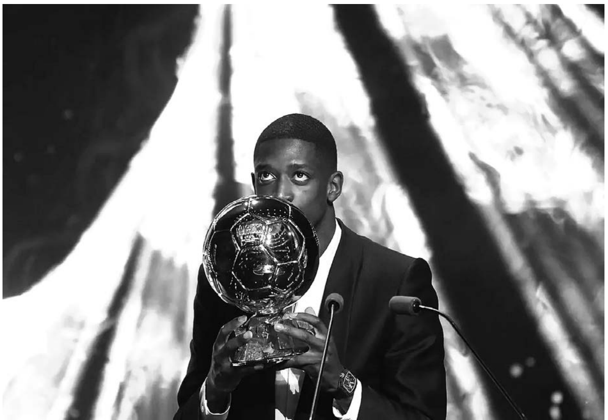
Нападающий французского футбольного клуба «Пари Сен-Жермен» и сборной Франции Усман Дембеле, ставший обладателем «Золотого мяча» в 2025 году