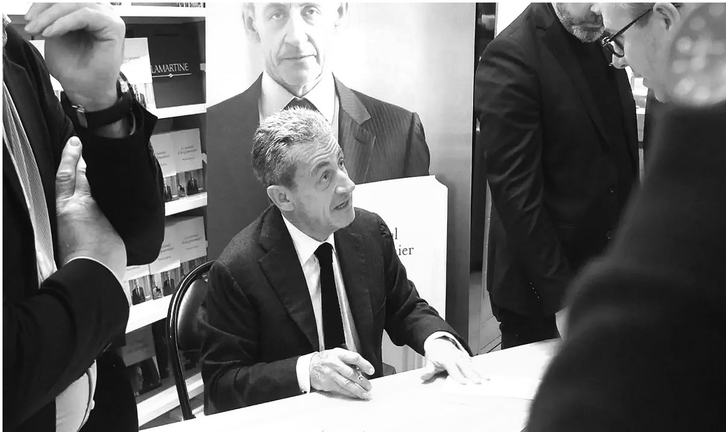
Николя Саркози на автограф-сессии