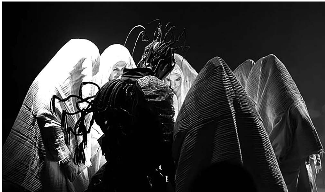
Перформанс — сплав движения, танца, звука, музыки

поэт, автор ютуб-канала «Dergachyov Insight», специально для «Новой — Казахстан»