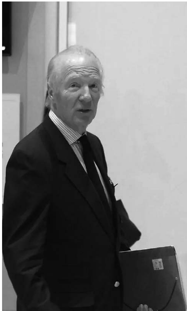
Экс-глава МВД Франции Брис Ортефё в Парижском дворце правосудия после очередного заседания по ливийскому делу

шум, небо, которого он никогда не видит и т.д. — повседневность тысяч заключенных», — преуменьшает газета испытания человека, брошенного на три недели в отдельную двенадцатиметровую камеру.