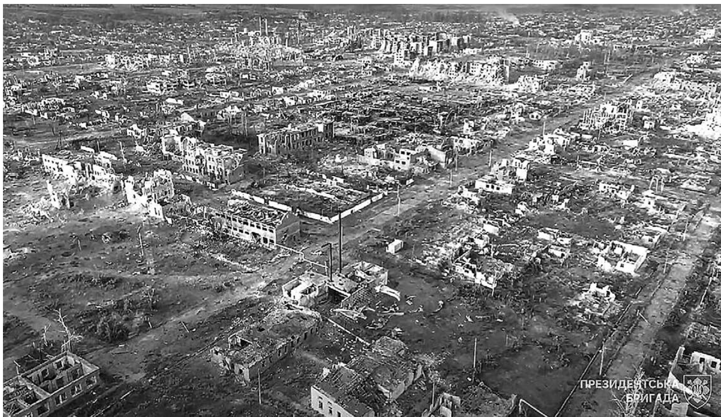
Разрушенный Вовчанск. Харьковская область

— Но при этом генералы могут видеть, как складывается реальная ситуация на земле. И иногда кажется, хотя я и не могу утверждать это стопроцентно, что будто бы генералы со всех сторон порой занимаются неким таким очковитатель-