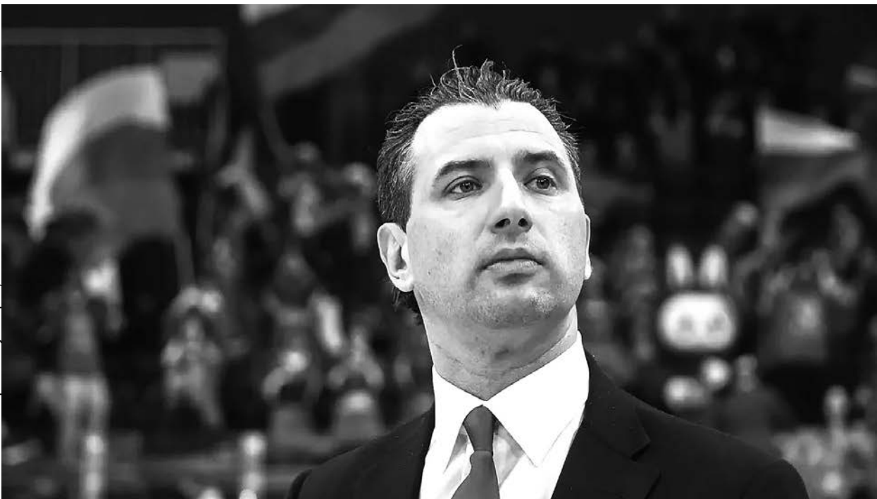
Новосибирск. Ледовая арена «Сибирь-Арена». Кубок Первого канала по хоккею. Главный тренер сборной России Роман Ротенберг