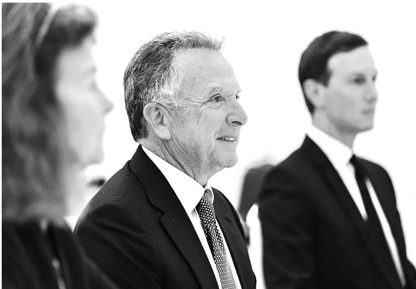
Стив Уиткофф (в центре) в Кремле

БЫВШИЕ ПРЕЗИДЕНТЫ — И ДЕМОКРАТЫ, И РЕСПУБЛИКАНЦЫ — ГОВОРИЛИ О «ЦЕННОСТЯХ», ТРАМП С САМОГО НАЧАЛА ВТОРОГО СРОКА ГОВОРIT О ДОЛЛАРАХ