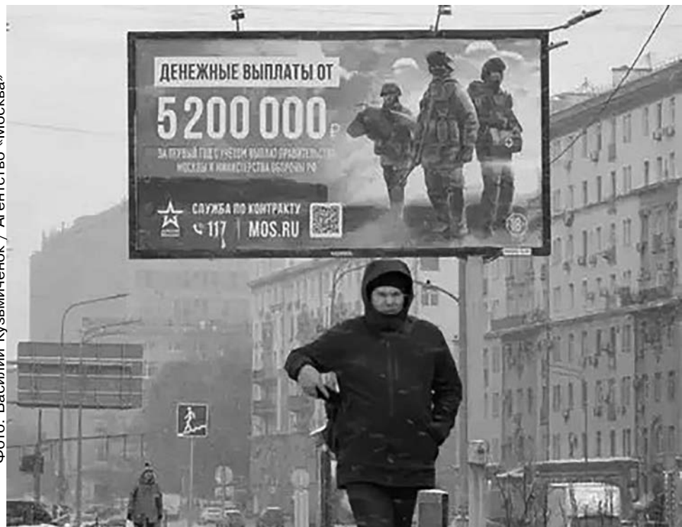
Баннер, призывающий служить в российской армии по контракту, 8 октября 2024 года