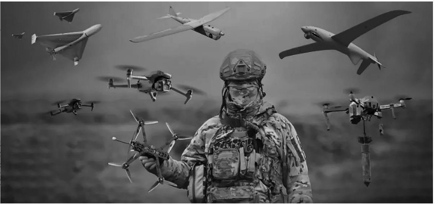
Дроны меняют стратегию и характер войны в Украине

Вторая мировая война началась кавалерийской атакой польского уланского полка на механизированную часть Германии (1 сентября 1939 года Поморский уланский полк в рамках оборонительных действий напал на отдыхающий немецкий батальон, но атаковал он при этом в первую очередь пехоту, а не тяжелую технику — прим. ред.). А закончилась она ядерными бомбардировками Хиросимы и Нагасаки. Уже применялись баллистические ракеты А-4 — имеется в виду «Фау-2», — которые летели к своей цели уже через безвоздушное пространство, фактически через космос, и набирали скорость намного выше сверхзвуковой.