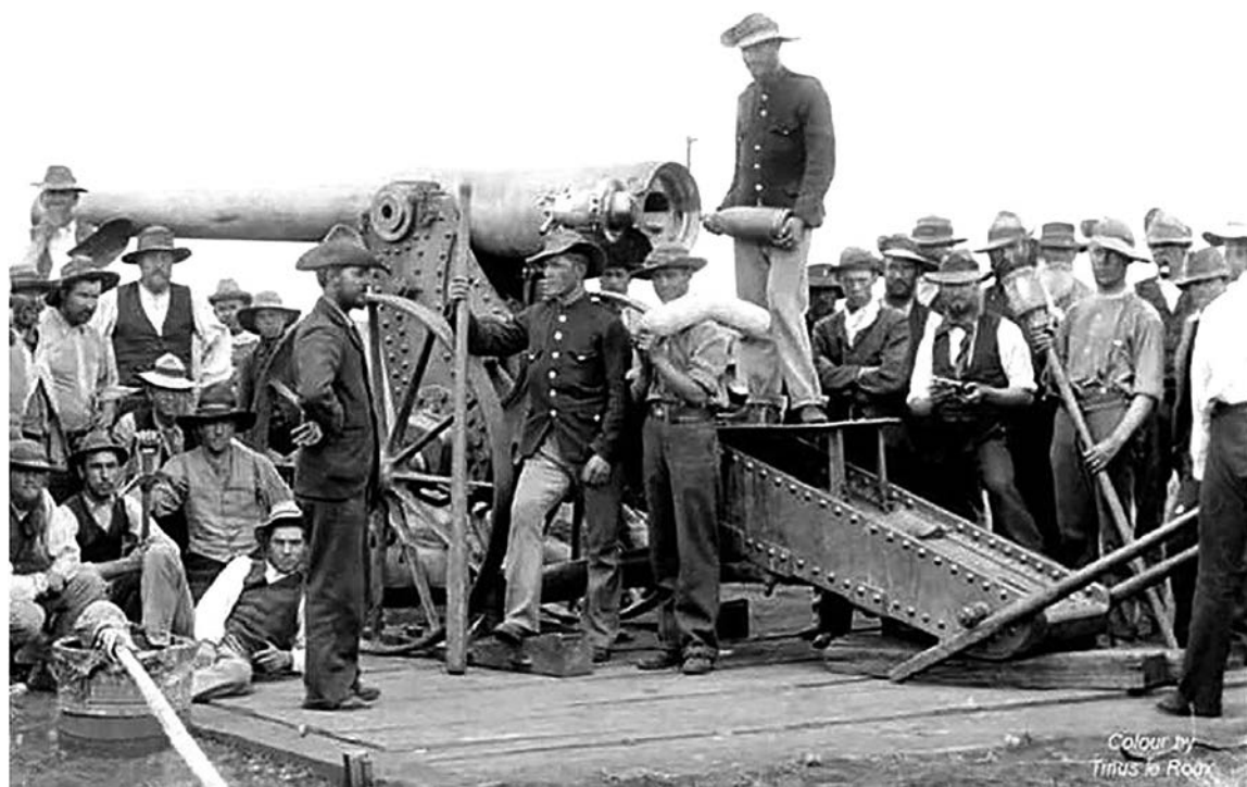
Англо-бурская война. 155-мм орудие «Длинный Том» на позициях под Ледисмитом