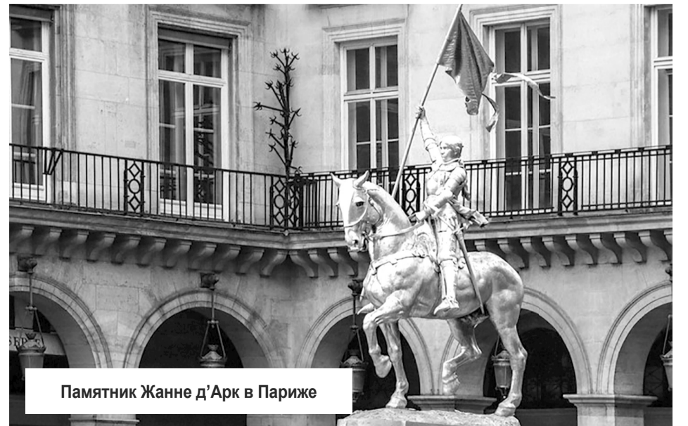
Памятник Жанне д'Арк в Париже

Что же касается противоречий, возникших между парижскими экспертами и местными судьями по вопросу о колдовстве, то они так никогда и не были разрешены. Вплоть до самого окончания охоты на ведьм в начале XVII века во Франции существовали две противоположные точки зрения на данную проблему, а многие демонологи даже делят себя не смогли решить, стоит ли относиться к колдовству как к реальности или все же как к иллюзии.