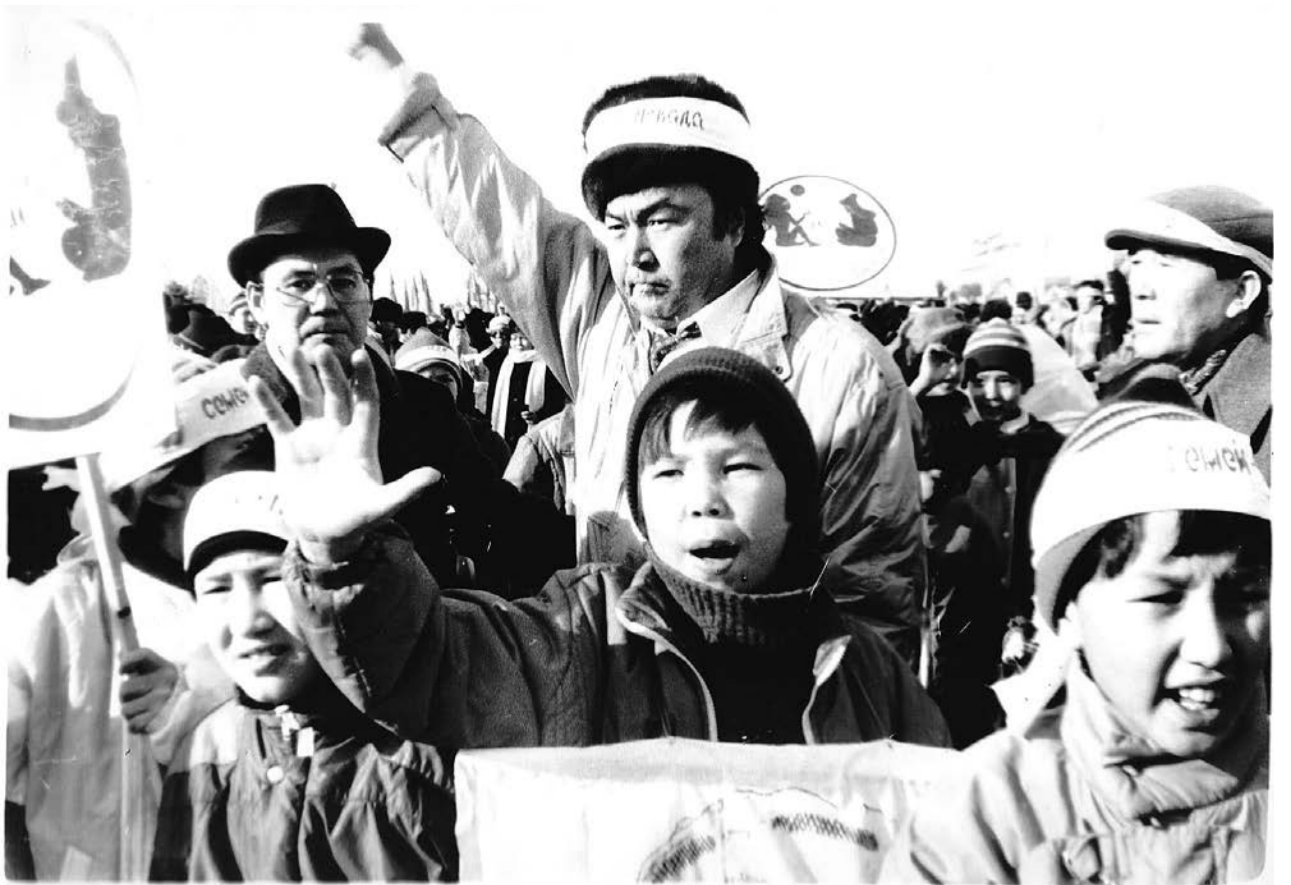
Олжас Сулейменов на митинге движения «Невада-Семипалатинск» 7 ноября 1989 г.

28 февраля исполняется 37 лет Движению «Невада-Семипалатинск». Однако многие факты из этой антиядерной истории Казахстана, актуальные для человечества сегодня, никак не отражены в учебниках новейшей истории. Об этом и о том, какая судьба ожидала некоторые высшие международные награды за антиядерную деятельность – в новом интервью лидера международного антиядерного Движения «Невада-Семипалатинск» – Олжаса Сулейменова.