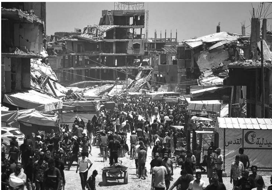
Внутренне перемещенные палестинцы идут среди руин района Аль-Туффа в восточной части города Газа, 11 февраля 2026 года

Газета The Guardian так описала участников заседания: «Авторитарные, сильные лидеры и диктаторы». Не всех из участников заседания можно отнести к одной из этих категорий, но большинству из них эти формулировки вполне подходят.