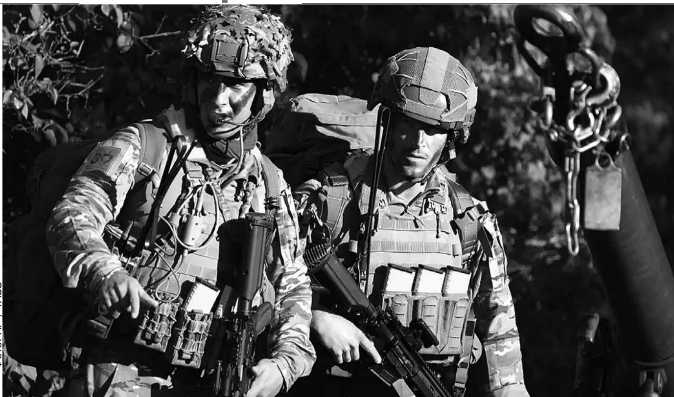
Эстония. Учения НАТО