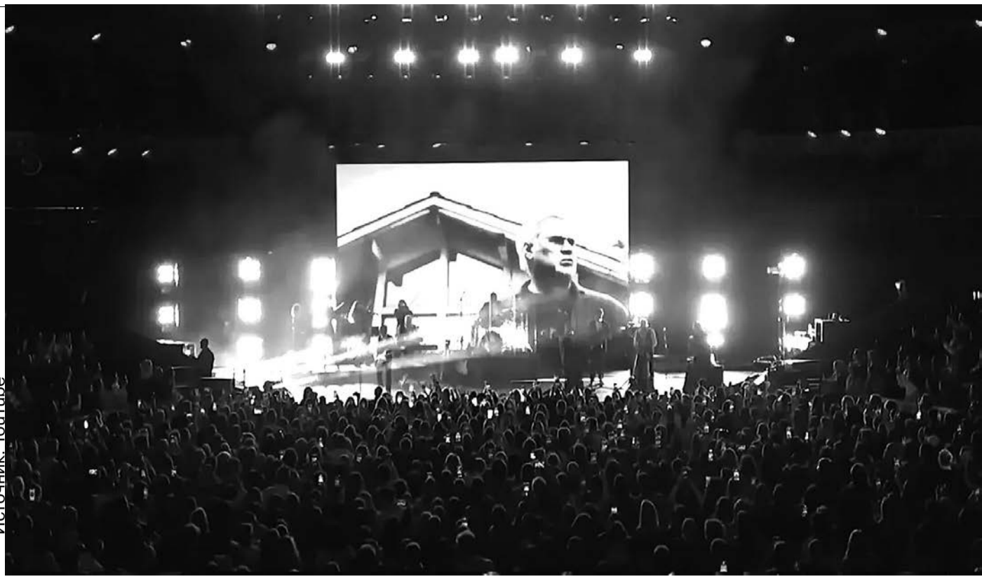
Концерт Валерия Меладзе в Albert Hall