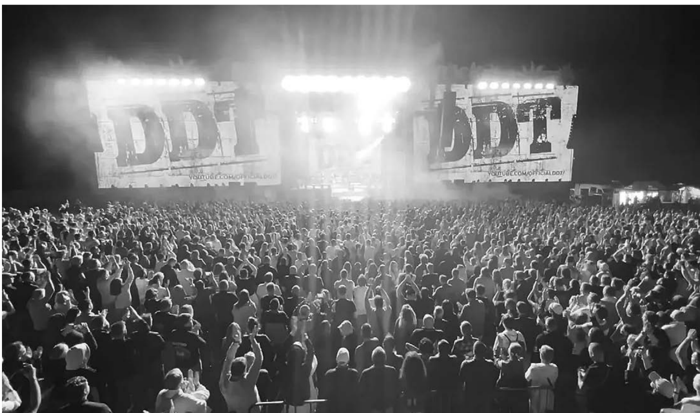
Концерт ДДТ в Кишиневе

У группы «Би-2» после 2022 года многие песни тоже раскрылись по-новому. Появились и новые, очень сильные, которые сейчас цементируют их сет-листы: «Я двигаюсь дальше», «Никому не верю». Команда производит впечатление очень активного коллектива: работа на сцене, PR-поддержка, новые клипы. Парни перезаписали один из главных своих хитов «Мой рок-н-ролл», в котором раньше на правах женского вокала солировала Юлия Чичерина (ставшая сейчас наиболее радикальной Z-певицей), теперь вместо нее — Монеточка*. 31 декабря они представили ностальгический, хорошо сделанный клип с кадрами из России, набравший за месяц 1,3 млн просмотров на YouTube. И конечно, профессионализм «Би-2» виден на концертах: видеомэппинг, стиль, сыгранность музыкантов, каждый из которых — немножко звезда. «Би-2» давно уже не дуэт Шуры и Лёвы, и нынешний состав их