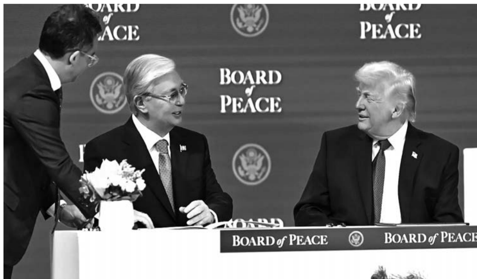
Дональд Трамп с Касым-Жомартом Токаевым во время заседания Совета мира в Американском институте мира имени Дональда Трампа в Вашингтоне, округ Колумбия, США, 19 февраля 2026 года