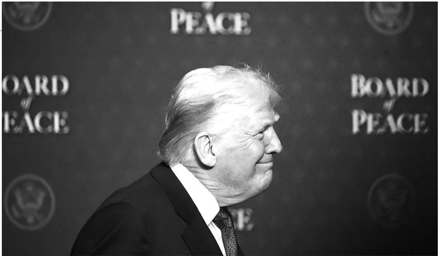
Дональд Трамп во время заседания Совета мира в Американском институте мира имени Дональда Трампа в Вашингтоне, округ Колумбия, США, 19 февраля 2026 года.