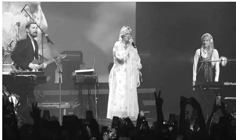
Noize MC, Наоко и Монеточка на одной сцене

Уральскую группу «Сансара» в свое время продвигали старшие товарищи из группы «ЧайФ», а после того, как «Сансара» заняла антивоенную позицию, Шахрин со товарищи их же и захейтили. В репертуаре «Сансары» есть песня со словами «Нам