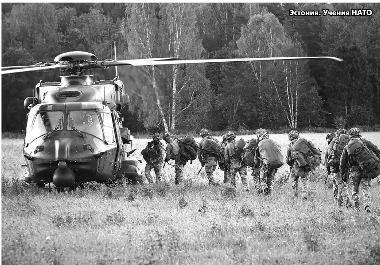
Эстония. Учения НАТО