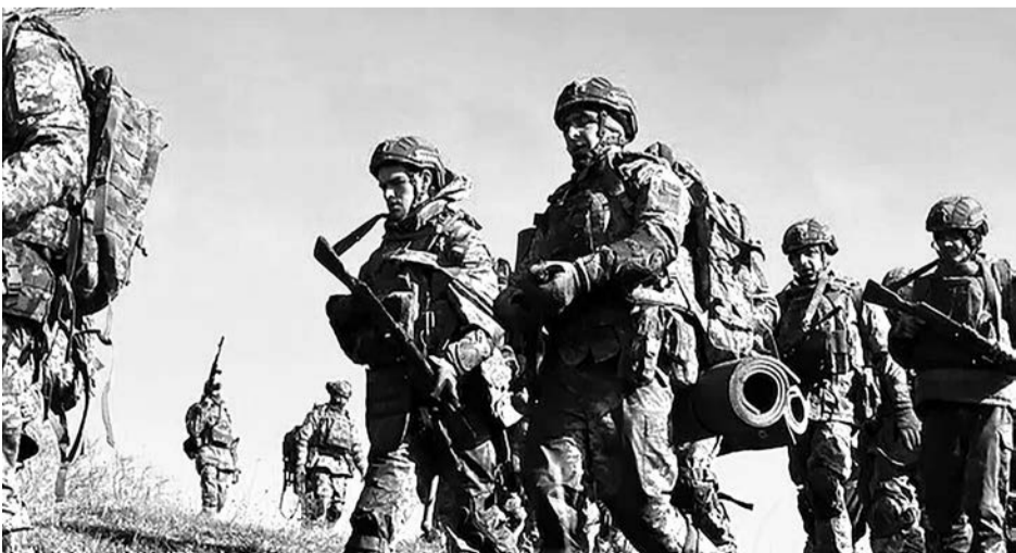
Новобранцы 65-й отдельной механизированной бригады ВСУ во время тренировки в Запорожской области, Украина, 22 февраля 2026 года

Впереди был путь, и даже в этом протяженном тоннеле не вместить и миллионной части той боли, которую Украина пережила за это время. Боли, которую Россия принесла в каждую нашу семью, в каждое украинское сердце.