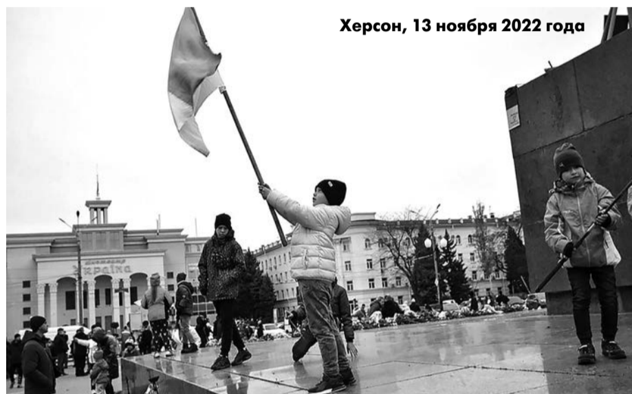
Херсон, 13 ноября 2022 года

А дальше что-то пошло не так. Да, собственно, всё пошло не так. Подобным образом с ходу, со всего размаху, налетают на стеклянную стену там, где ее, по идее, быть не должно.