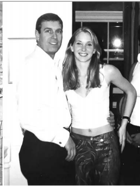
Принц Эндрю и Джеффри Эпштейн в Нью-Йорке / принц Эндрю и Вирджиния Робертс