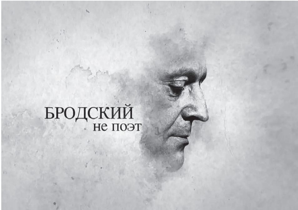
Фото: Постер фильма «Бродский не поэт»