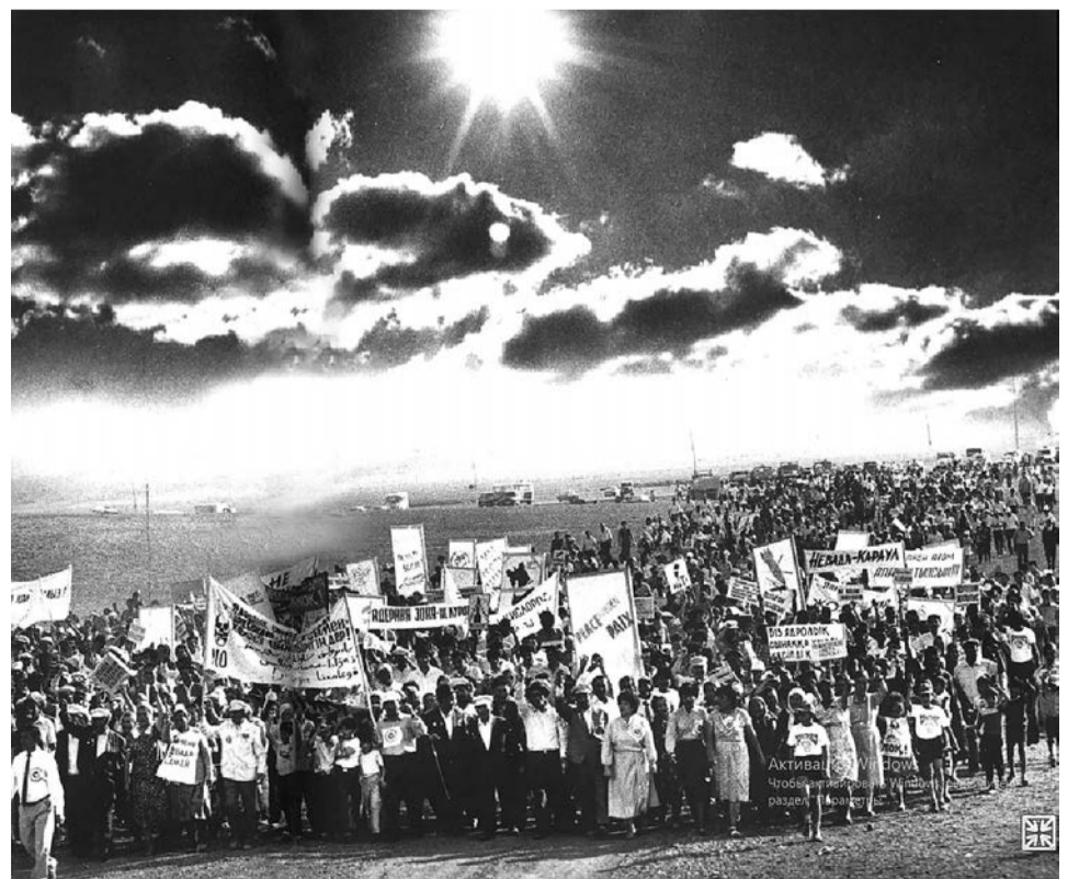
Митинг Движения «Невада-Семипалатинск»

Это был колоссальный шанс. Человечество уверенно шло к единству – к осознанной взаимозависимости и миру! И если бы не бездарное ГКЧП в августе 1991-го, которое развалило Советский Союз, все могло бы получиться. Тогда взаимоотношения Америки и России