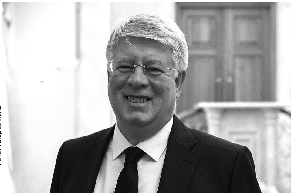
Чрезвычайный и Полномочный посол РФ в Республике Казахстан Алексей Бородавкин