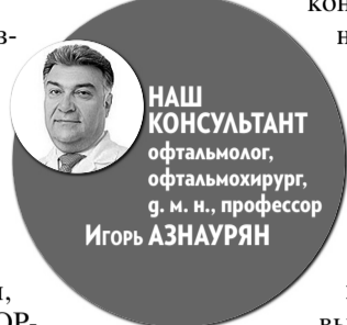
НАШ КОНСУЛЬТАНТ офтальмолог, офтальмохирург, г. м. н., профессор Игорь АЗНАУРЯН

Очки получают ряд негативных комментариев, главная претензия – неудобства, связанные с запотеванием линз и ограниченным полем зрения. И это так. Но есть плюс, перевешивающий минусы. Очки – это барьер для инфекций, пыли. В период эпидемий ОРВИ или при цветении растений они спасают от кератитов. Конъюнктивит, блефарит, насморк – в этих случаях контактные линзы под строгим запретом. Поэтому пара очков, изготовленных по актуальному рецепту, должна быть у каждого человека, нуждающегося в коррекции зрения. Это не запасной вариант, а экстренная медицинская помощь.