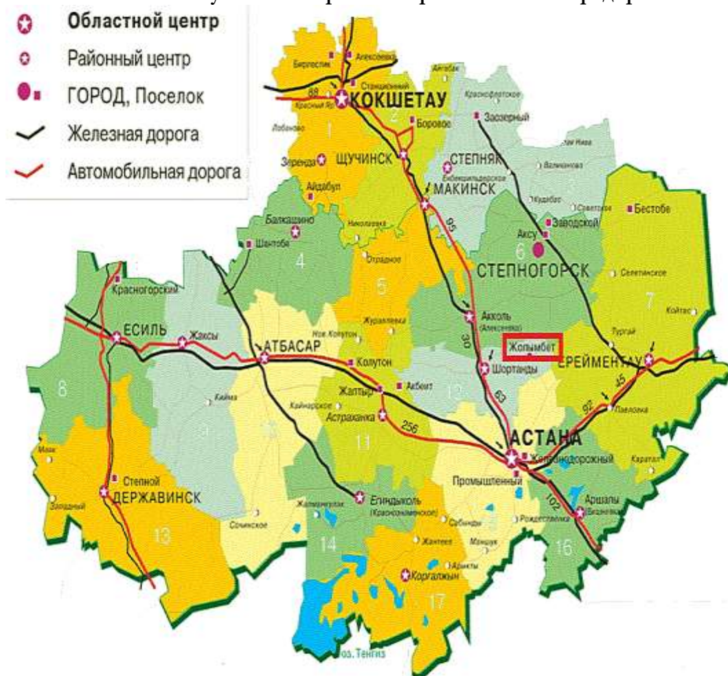
Рисунок 11.1 Карта месторасположения предприятия

Обзорная карта района расположения месторождения «Жолымбет» приведена на рисунке 1.1.