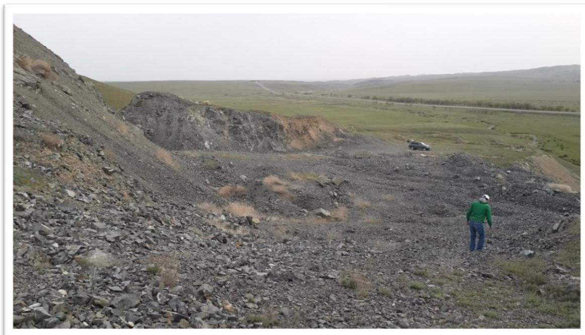
Рис. 4.1 Поверхность месторождения «Базальт»