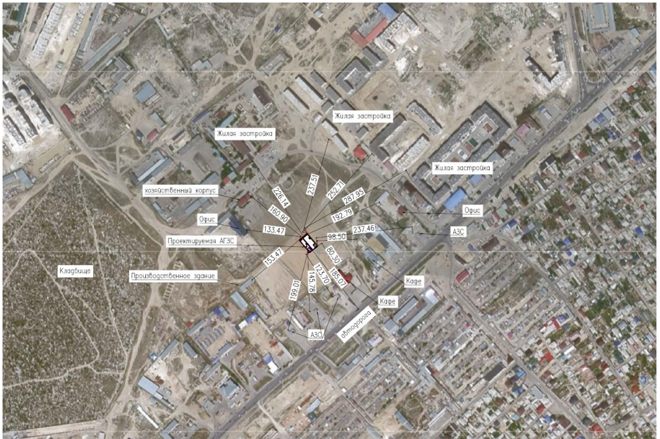
Рис. 1.1. Ситуационная карта расположение АГЭС