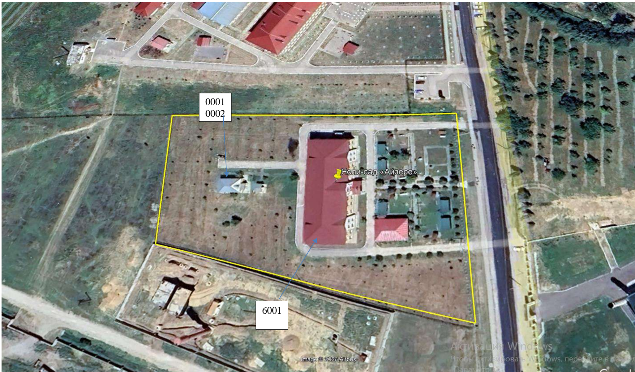
Карта-схема предприятия с нанесенными на нее источниками выбросовзагрязняющих веществ