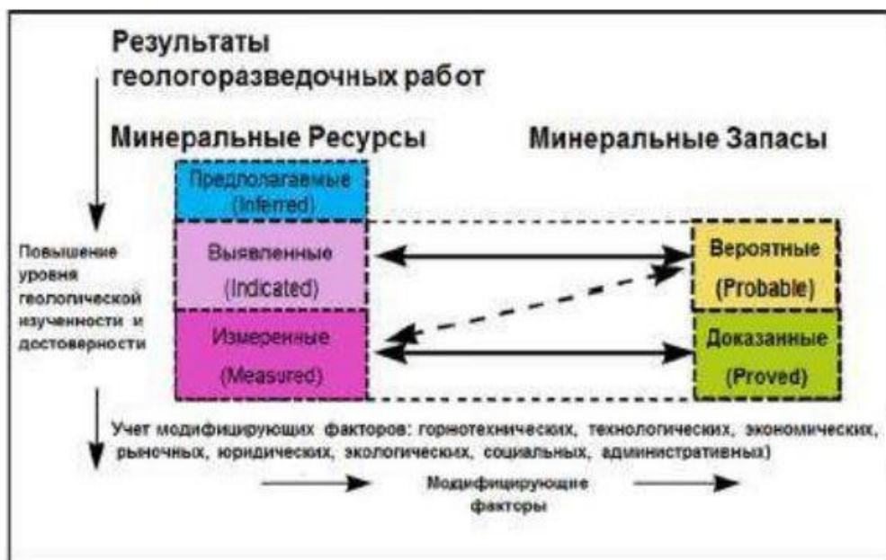
Рис. 2.1 Взаимоотношения между результатами геологоразведочных работ, минеральными ресурсами и минеральными запасами

Кодекс KAZRC определяет Измеренные, Выявленные и Предполагаемые ресурсы следующим образом: во всех трех случаях должна иметься перспектива их окончательной экономически целесообразной выемки.