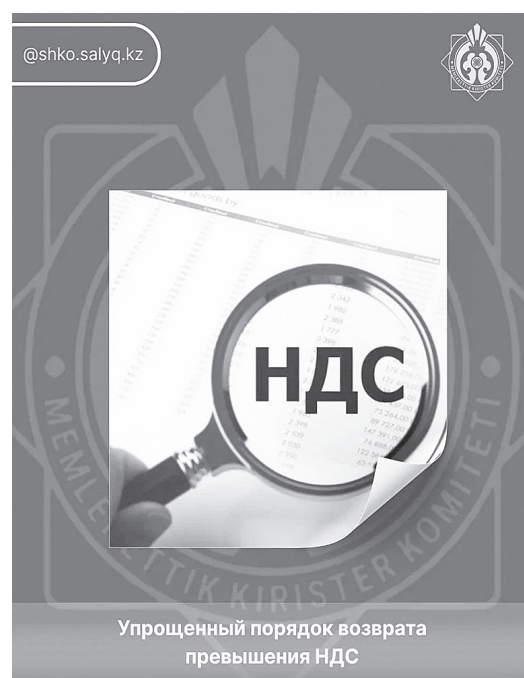
Упрощенный порядок возврата превышения НДС

2) наличия подтвержденной к возврату по результатам налоговой проверки суммы