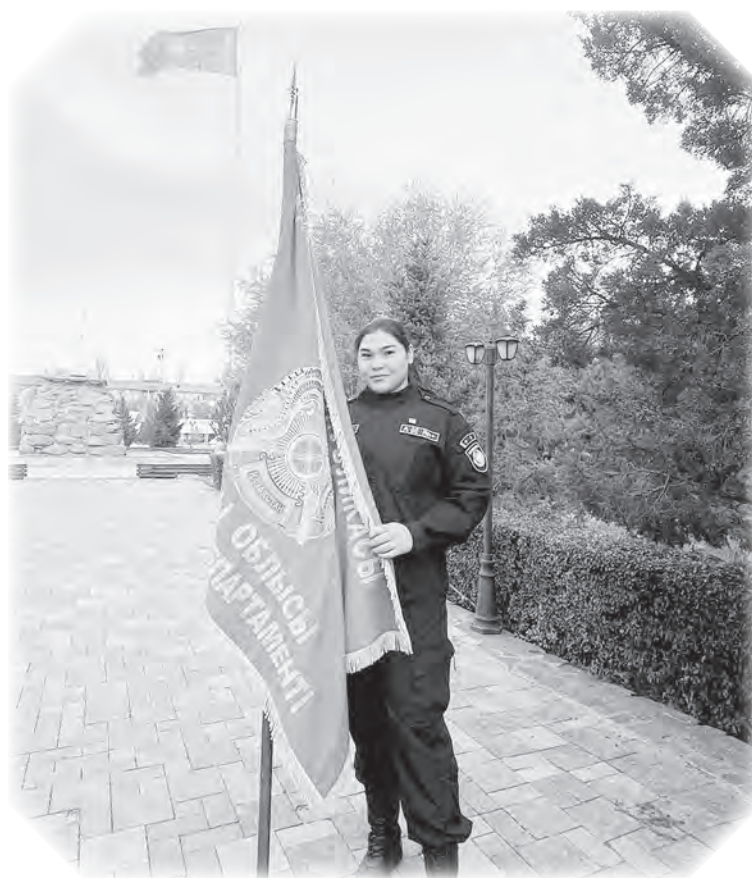
удаётся поддерживать форму при таком напряженном графике?

Многие спортсмены говорят, что совмещать службу и профессиональные тренировки практически невозможно. Как Вам