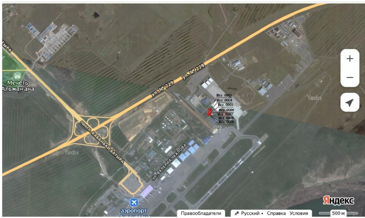
Рисунок – 2. Карта схема расположения источников выбросов