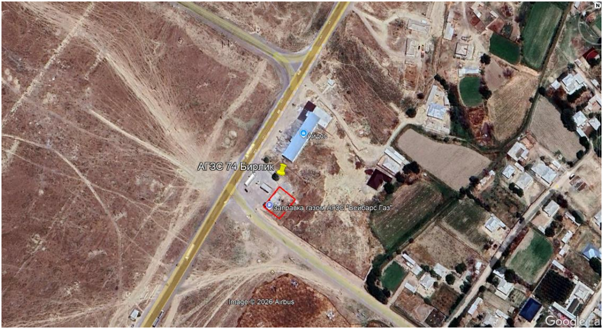
Рис.1. Ситуационная карта-схема проектируемого участка