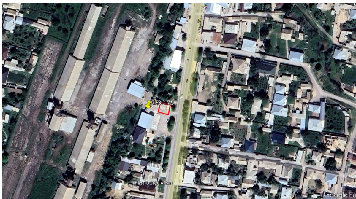
Рис.1. Ситуационная карта-схема проектируемого участка