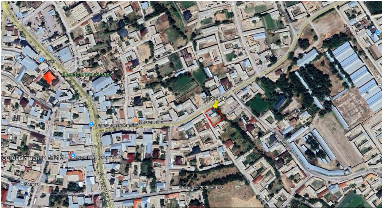
Рис.1. Ситуационная карта-схема