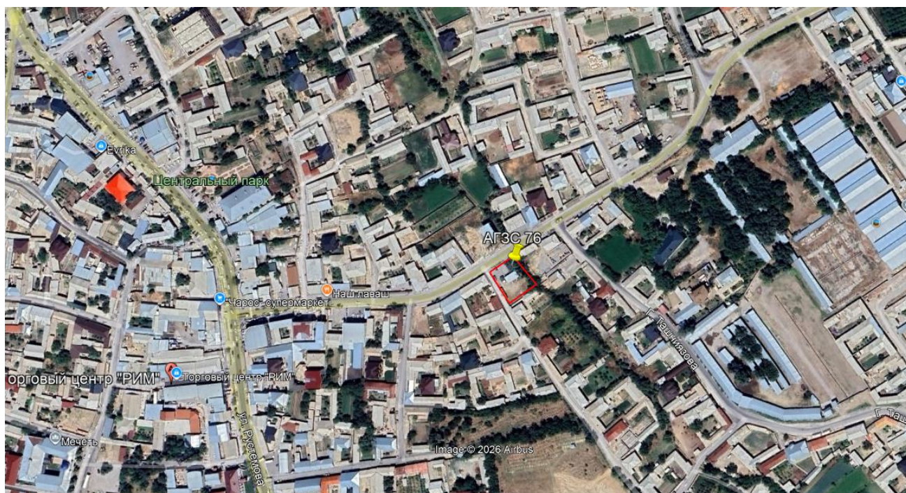
Рис.1. Ситуационная карта-схема

Категория экологической опасности намечаемой деятельности – автозаправочные станции по заправке транспортных средств жидким и газовым моторным топливом определена как 3 категория согласно, Экологического кодекса РК от 02.01.2021 г. (Приложение 2, раздел 3, п.1, пп.72: автозаправочные станции по заправке транспортных средств жидким и газовым моторным топливом).