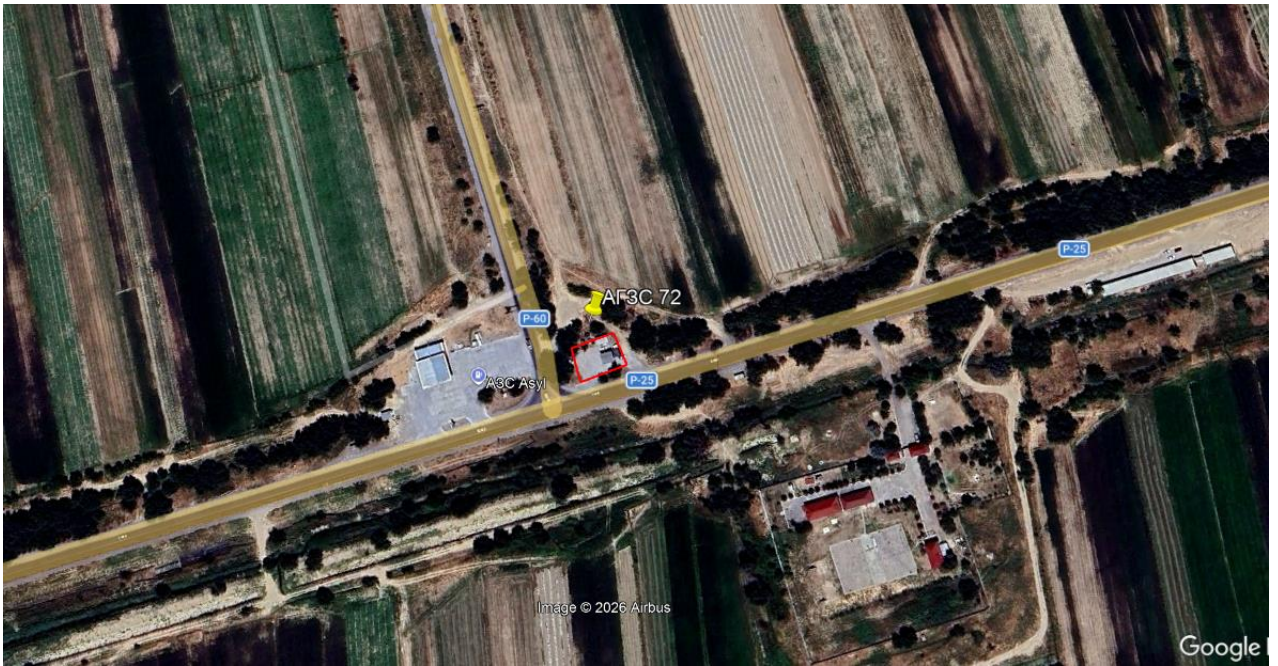
Рис.1. Ситуационная карта-схема проектируемого участка