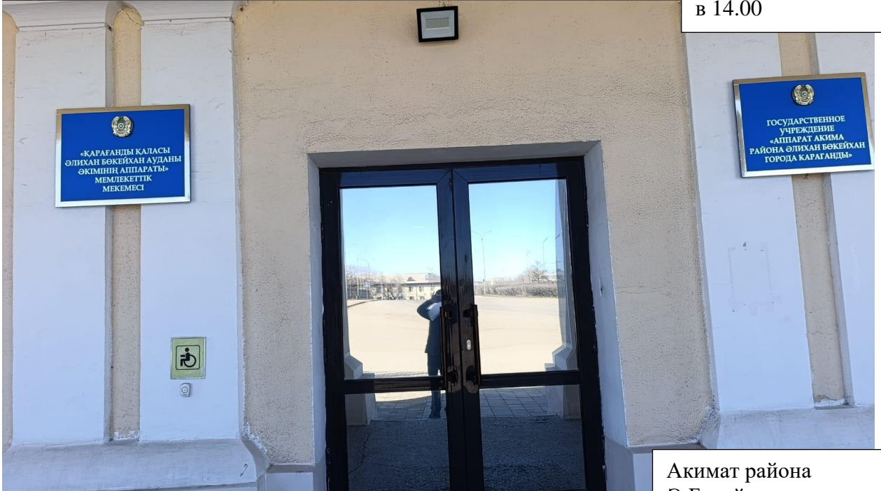
Акимат района Ә.Бокейхана Ул. Архитектурная, 13 в 14.00