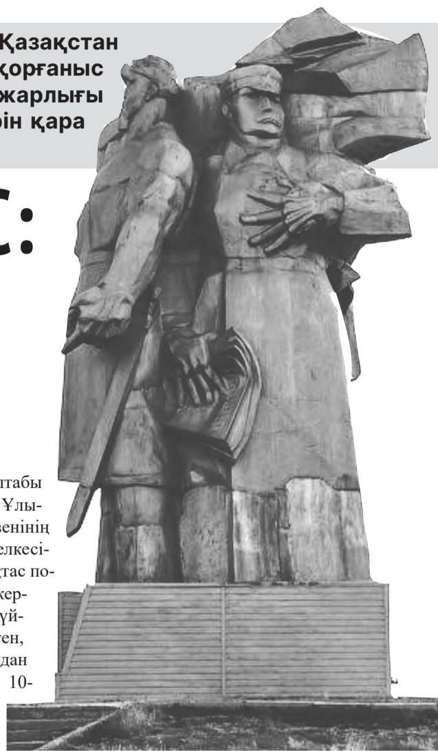
Аманкелді Иманов, Әліби Жанкелдин және көтерілісші-сарбаздарға арналған ескерткіш

Жоғарыда аталған ескерткіштер – ортақ тарихымыздың көзі. Алайда,