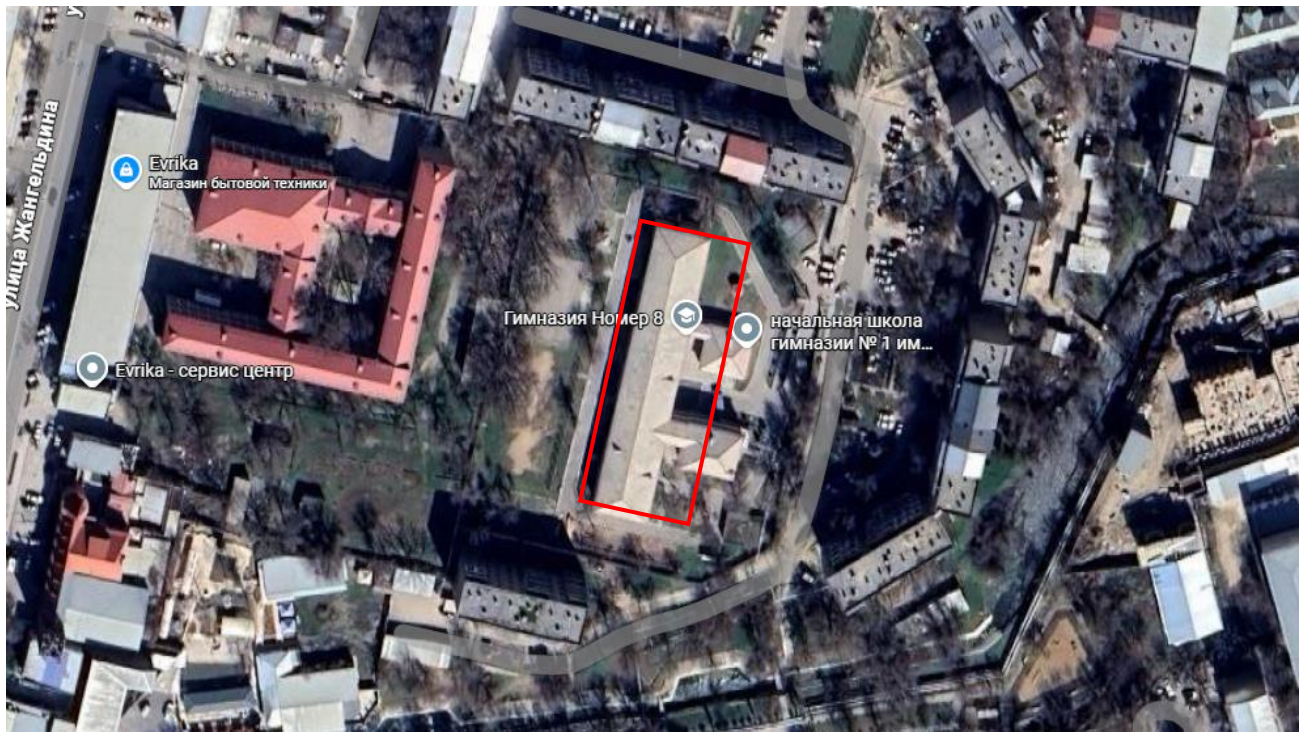
Ситуационная карта начальных классов