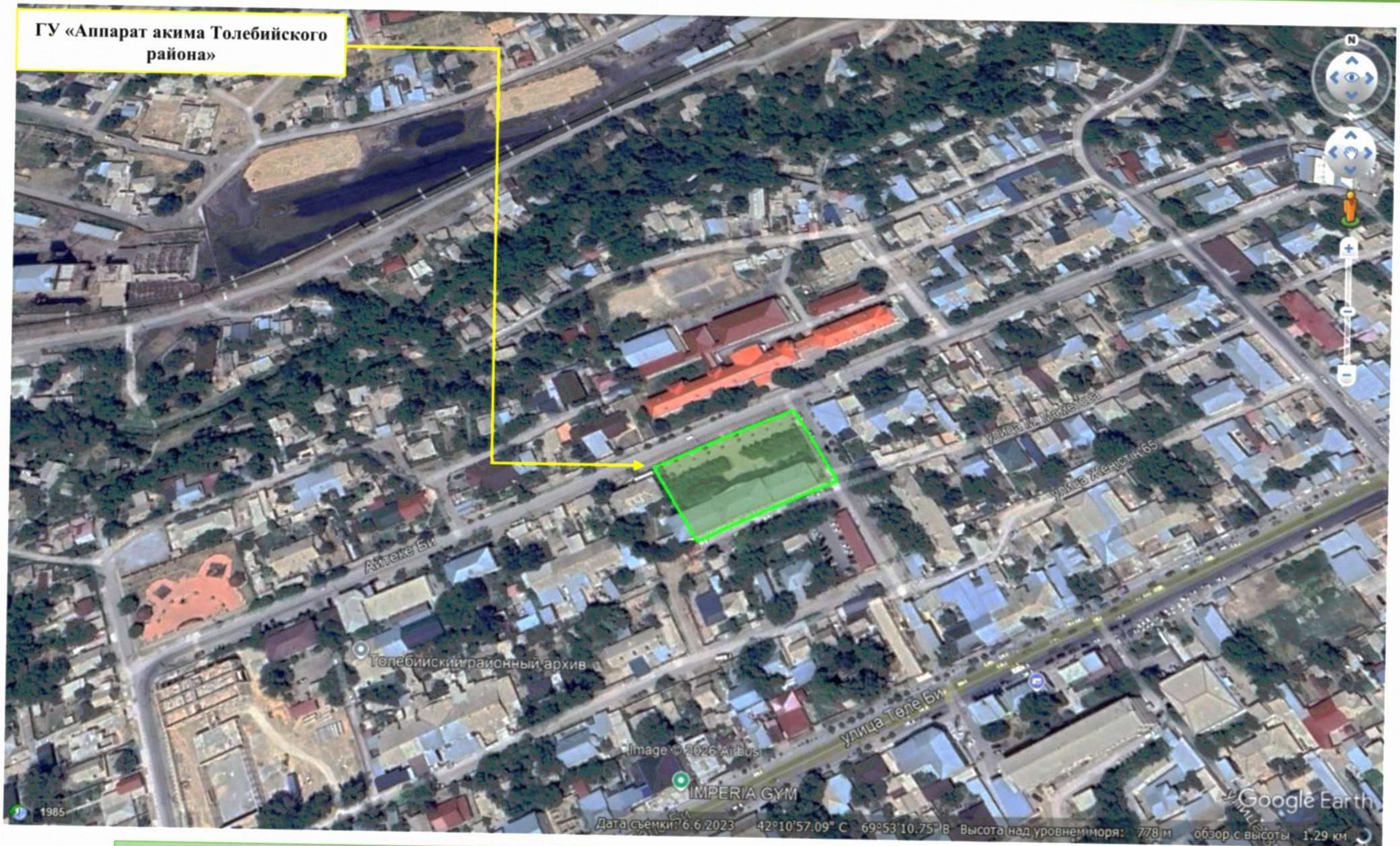
Рисунок 1.2. Карта-схема территории объекта