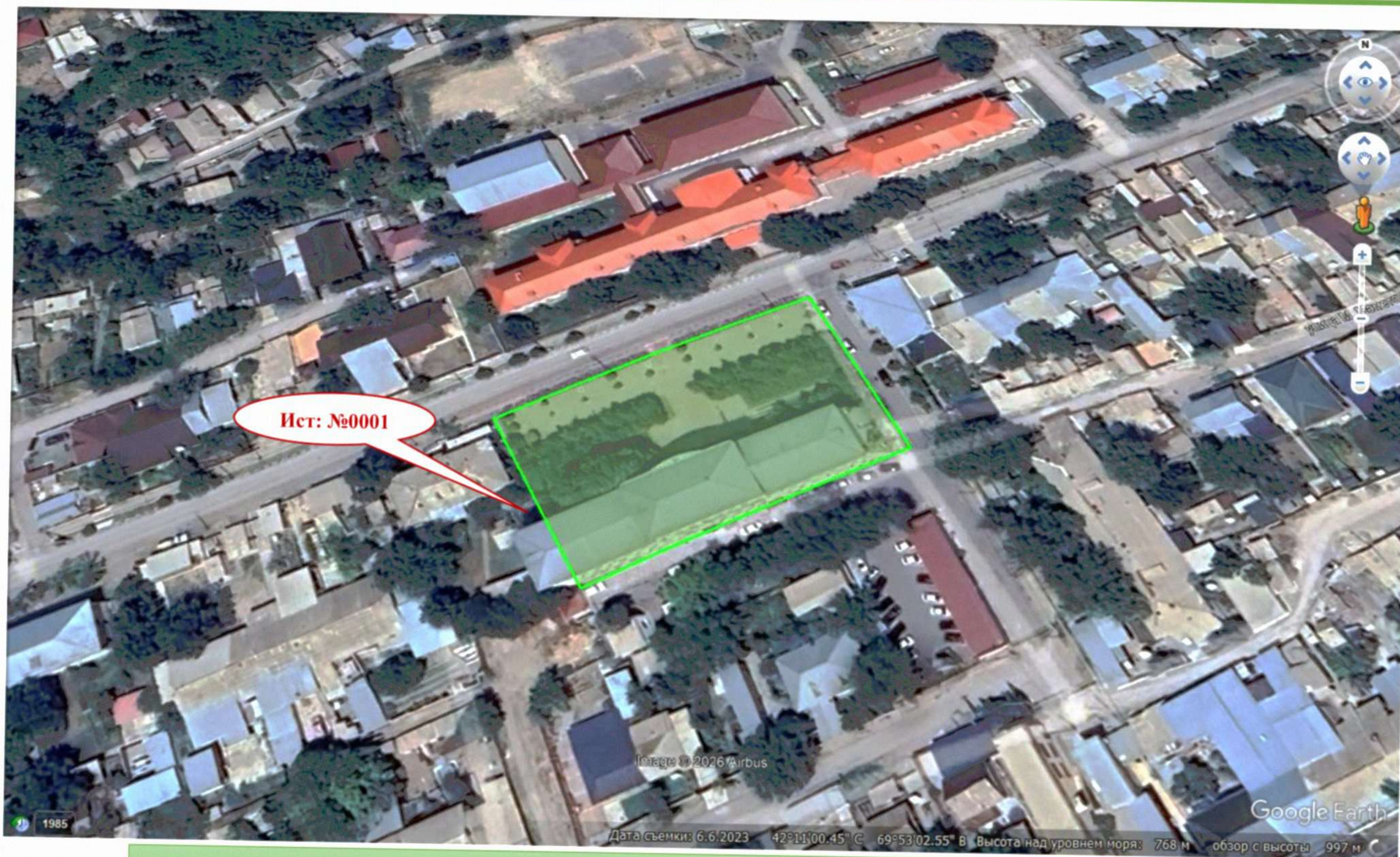
Рисунок 1.3. Карта-схема территории объекта с указанием источников загрязнения