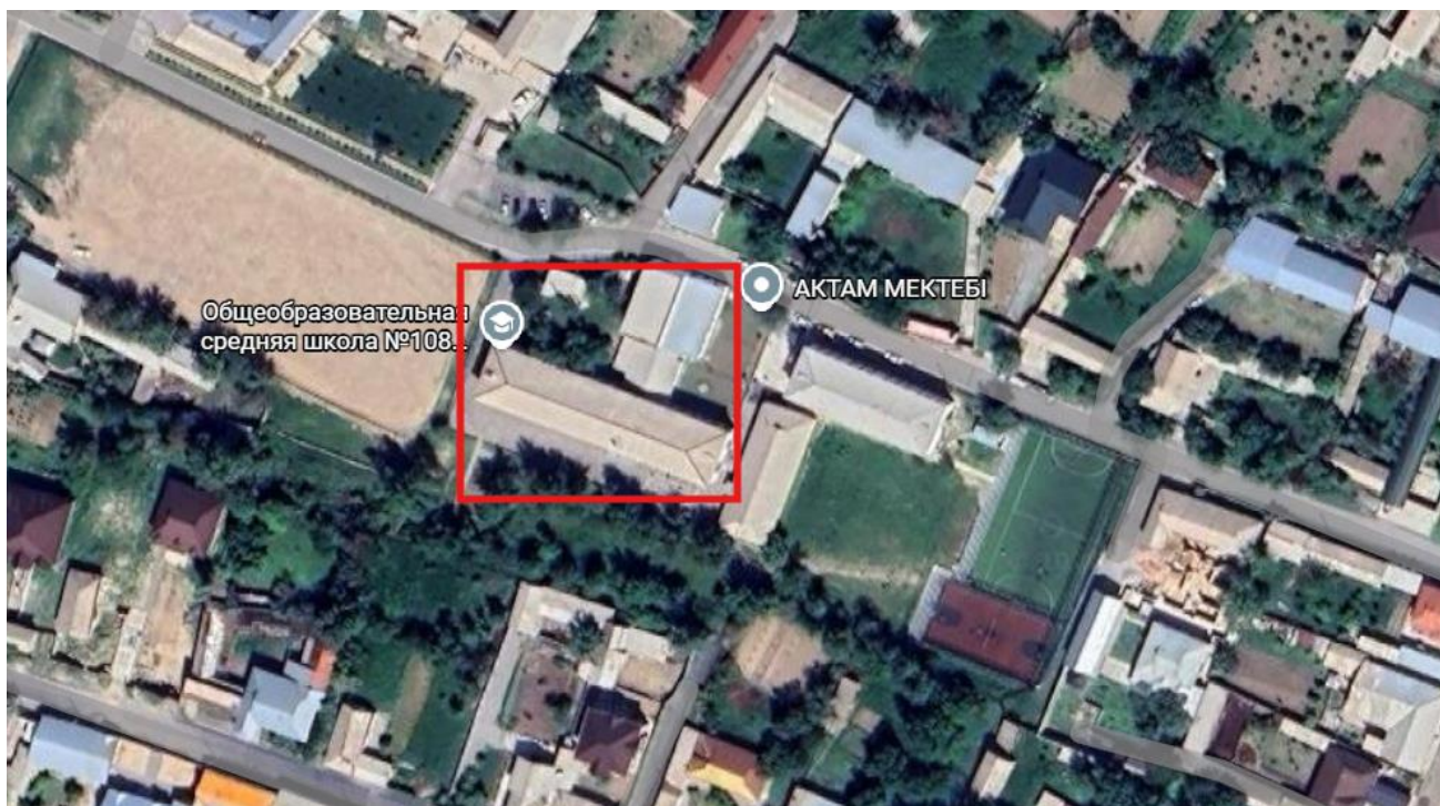
Ситуационная карта головного корпуса