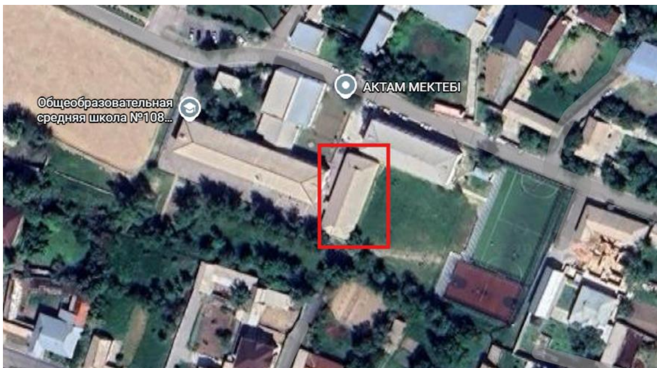
Ситуационная карта начальных классов