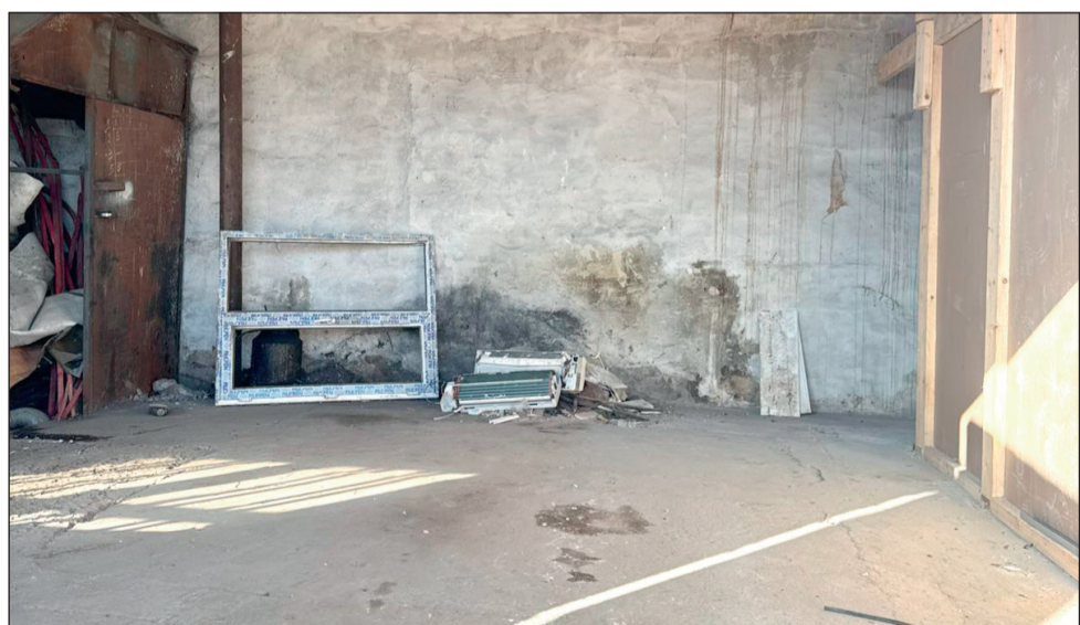
Подготовка объекта ведётся на базе ТОО «Колос-Фирма» при поддержке акимата Денисовского района

делает наличие местного поста особенно важным для оперативного реагирования.