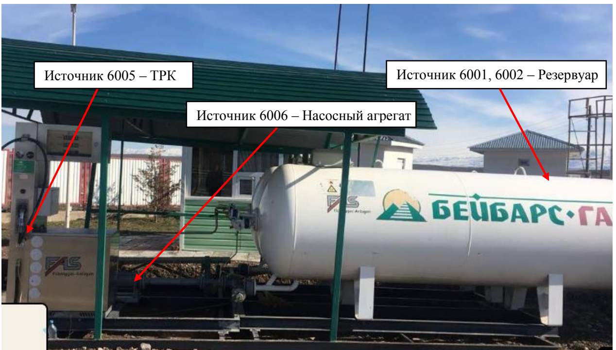
Рис. 1.1. Карта-схема объекта с нанесенными на нее источниками выбросов загрязняющих веществ в атмосферу