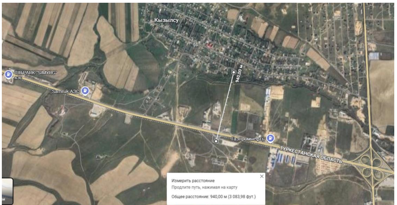
Рис 2. Ситуационная карта с указанием расстояния до ближайшей жилой застройки.