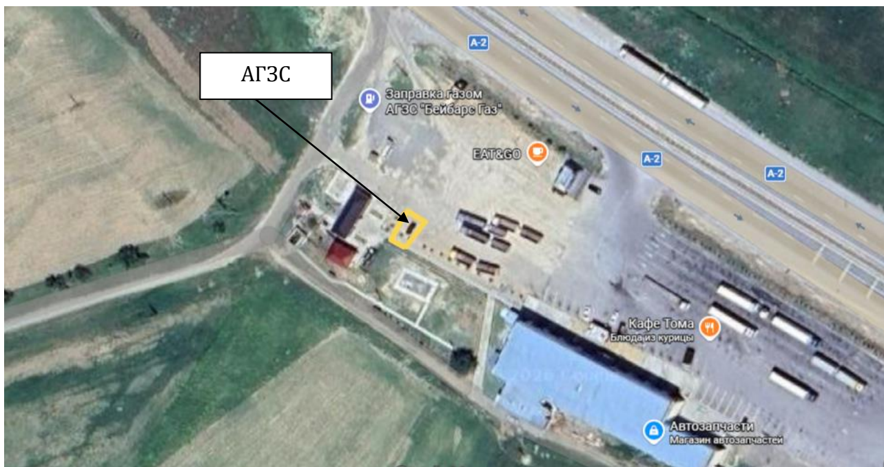
Рис 1. Ситуационная карта района расположения объекта.