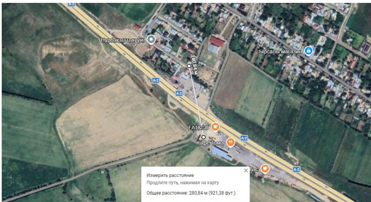
Рис 2. Ситуационная карта с указанием расстояния до ближайшей жилой застройки.