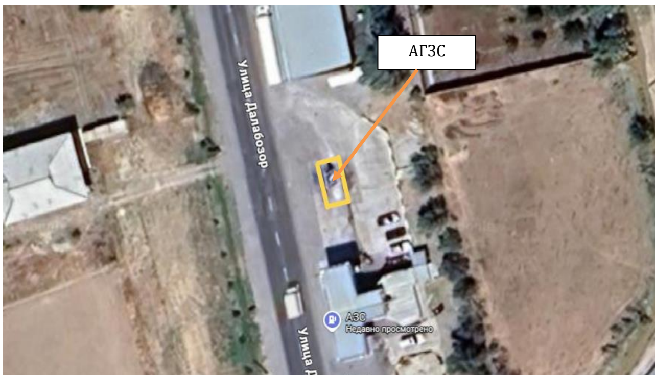
Рис 1. Ситуационная карта района расположения объекта.