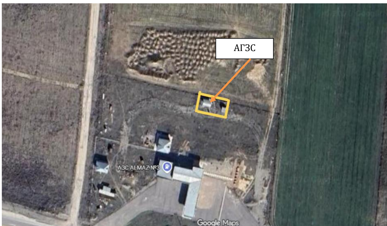
Рис 1. Ситуационная карта района расположения объекта.