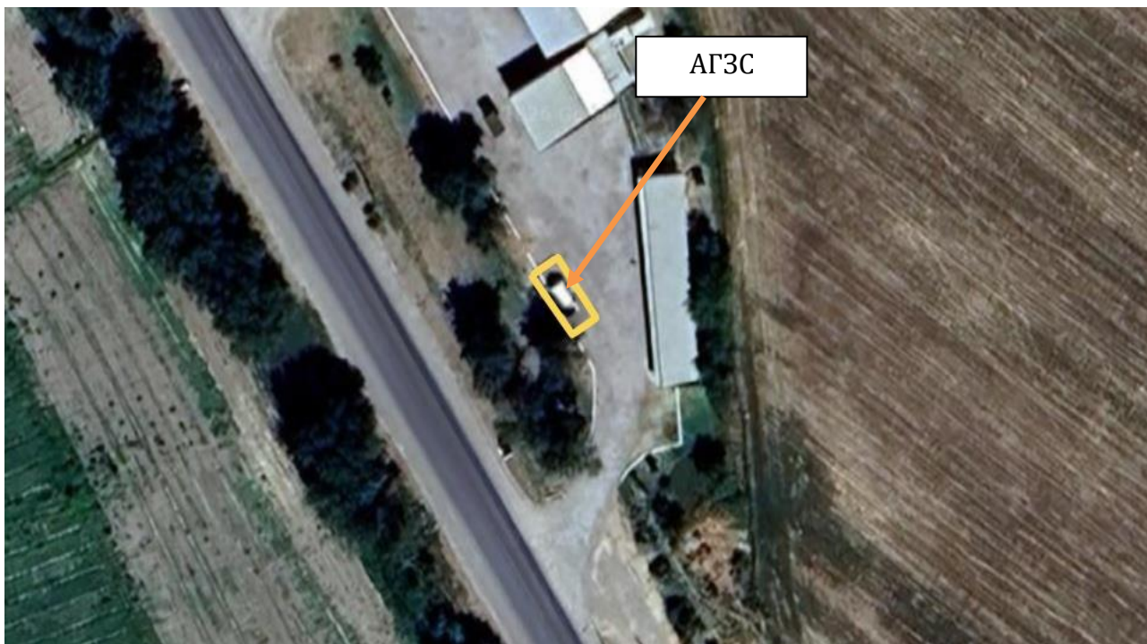
Рис 1. Ситуационная карта района расположения объекта.