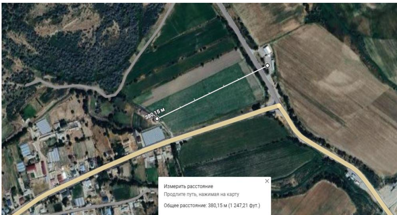
Рис 2. Ситуационная карта с указанием расстояния до ближайшей жилой застройки.