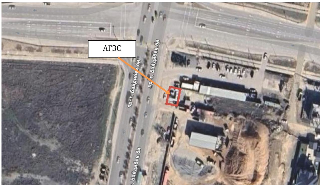
Рис 1. Ситуационная карта района расположения объекта.