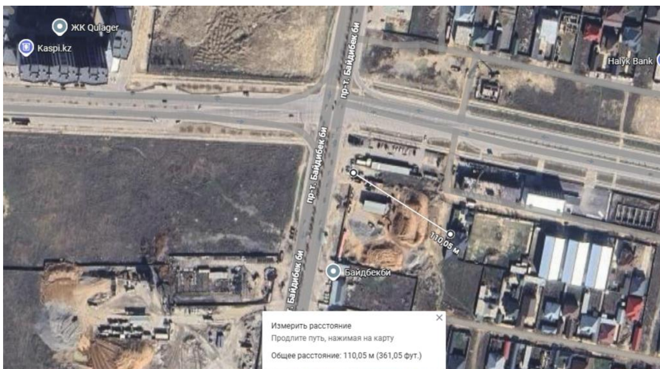
Рис 2. Ситуационная карта с указанием расстояния до ближайшей жилой застройки.