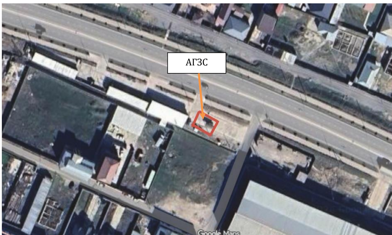
Рис 1. Ситуационная карта района расположения объекта.