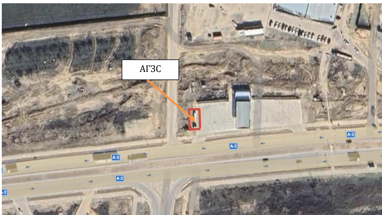
Рис 1. Ситуационная карта района расположения объекта.