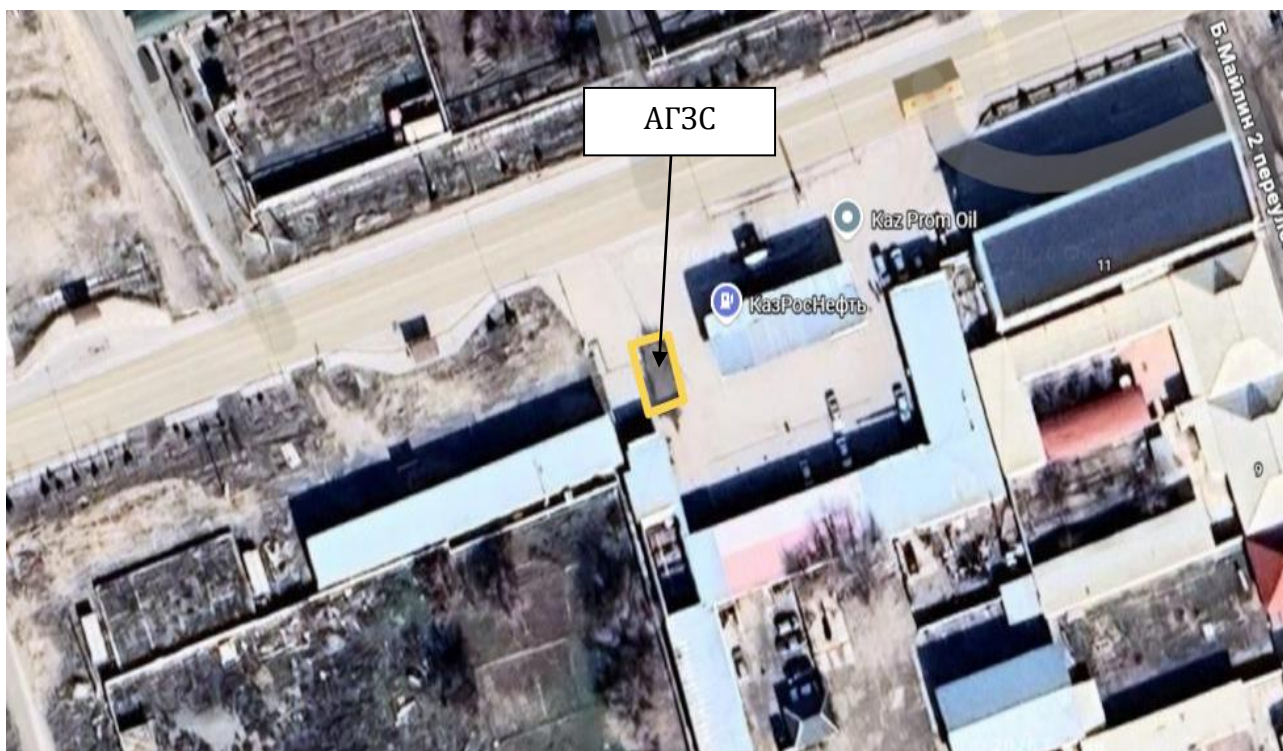
Рис 1. Ситуационная карта района расположения объекта.