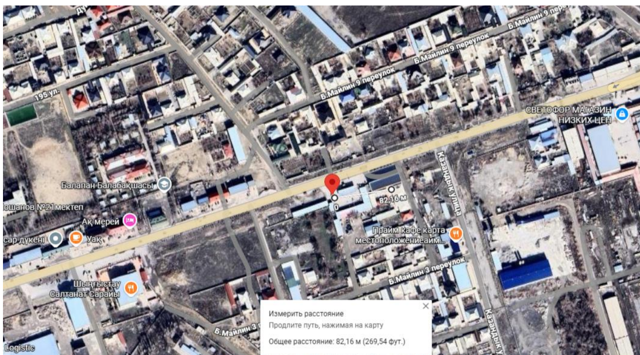
Рис 2. Ситуационная карта с указанием расстояния до ближайшей жилой застройки.